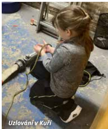
Uzlování v Kuří

1. náměstek starosty SDH Čestlice, zastupitel obce