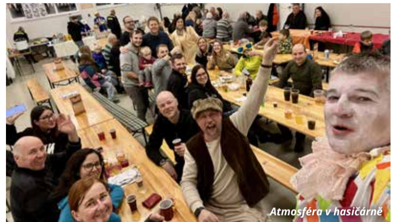
Atmosféra v hasičárně