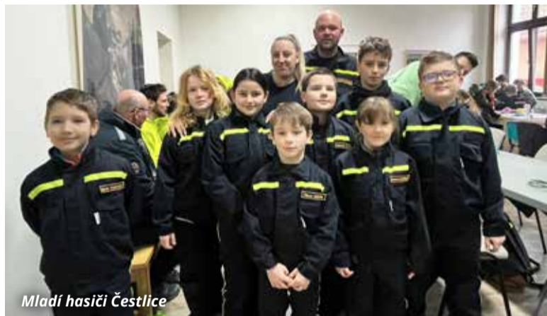
Mladí hasiči Čestlice