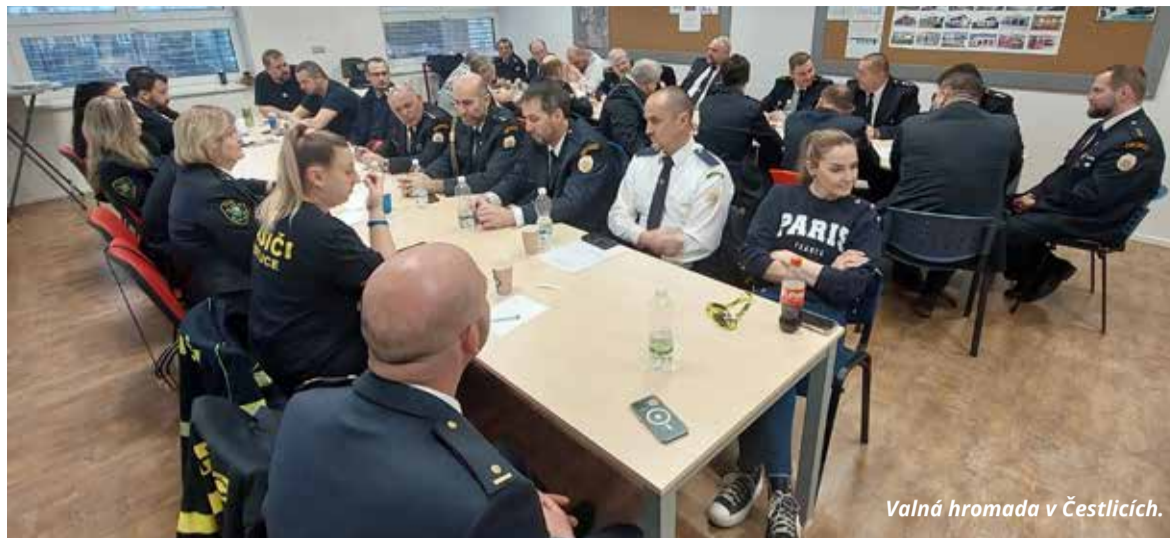
Valná hromada v Čestlicích.

Děti předvedly nejen šikovnost a rychlost, ale také týmového ducha a odhodlání, které je pro hasičskou práci tak důležité.