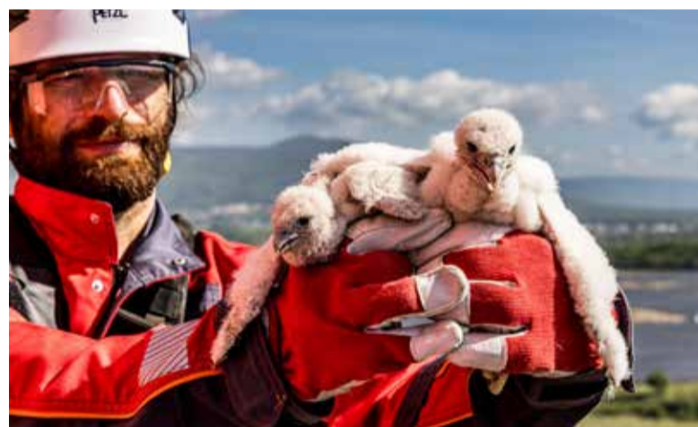
Péče o mláďata sokola stěhovavého.