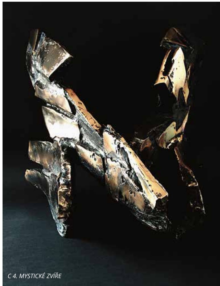
C 4. MYSTICKÉ ZVÍŘE

Nenechte si ujít jedinečnou příležitost setkat se s fascinující tvorbou výjimečné umělkyně, jejíž díla rezonují napříč časem i kontinenty.