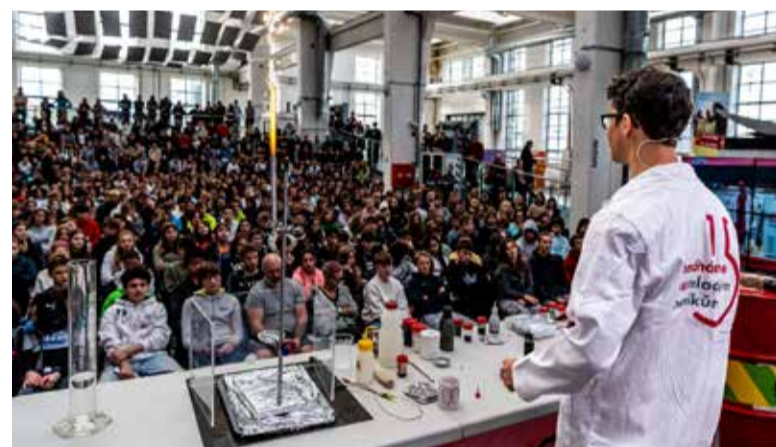
Hlavním posláním nadace bylo a je vzdělávání včetně podpory grantových a stipendijních programů.