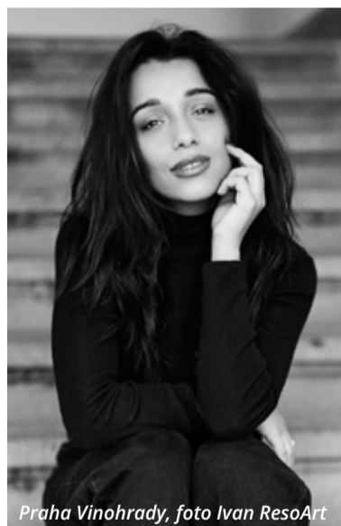
Praha Vinohrady