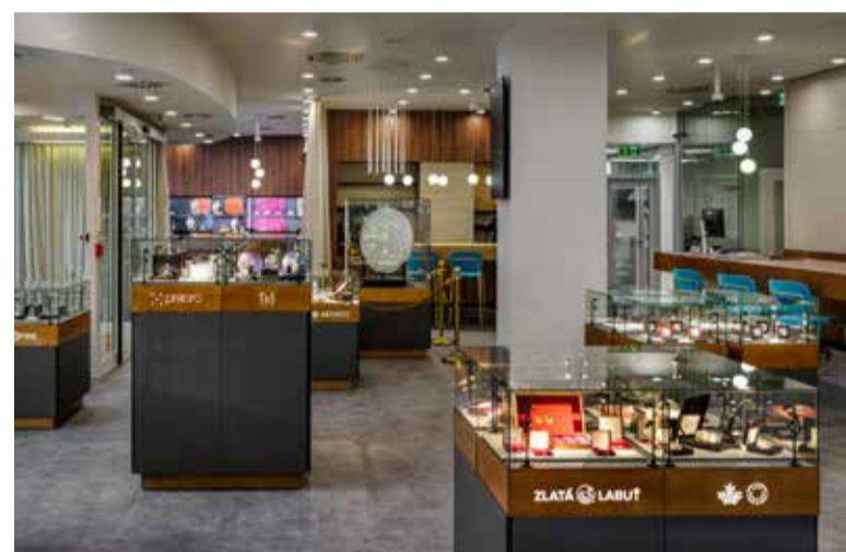
Interiér butiky Zlatá labuť.