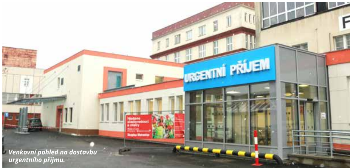
Venkovní pohled na dostavbu urgentního příjmu.

Investiční akce s předpokládanými náklady 105,6 milionu Kč je finančně kryta převážně z dotačního titulu „103. výzva IROP – Vznik a modernizace sítě urgentních příjmů“ a za 15% spoluúčasti z dotační podpory od Ústeckého kraje. Předpokládané investiční nákla-