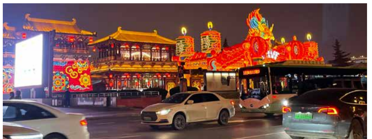
Čínský automobilový průmysl je skutečný drak, který roste a sílí.