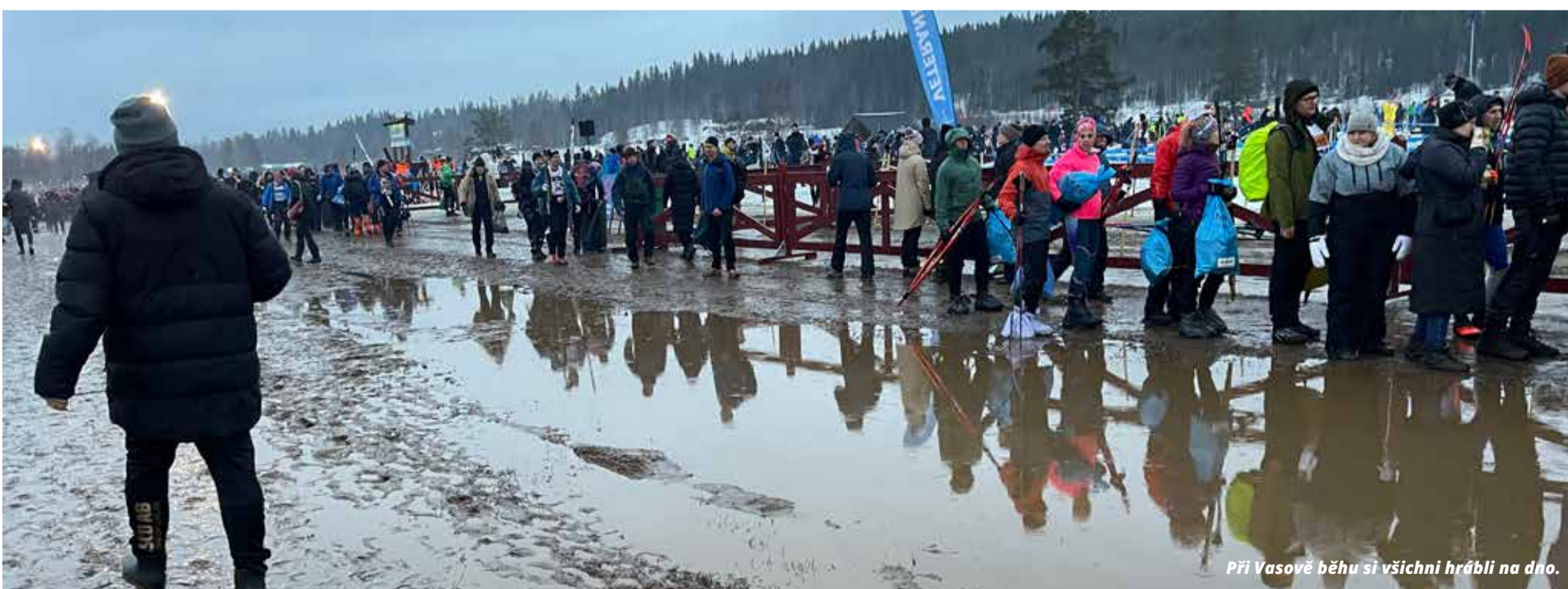
Při Vasově běhu si všichni hrábli na dno.