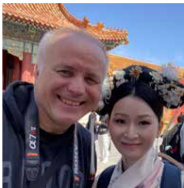
Během své cesty navštívil i Zakázané město. Lidé jsou všude zdvořilí a na ulicích je bezpečno.