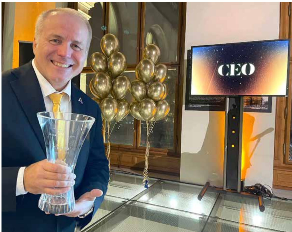
Měl jsem tu čest převzít cenu prestižního časopisu CEO za druhé místo v kategorii nejúspěšnější muž českého byznysu za rok 2022. Moc si toho vážím.

Takže další křížovatkou bylo, když jsem v roce 1992 opustil teplé místo v Komerční bance, kde jsem byl na zajímavém postu, obchodováním s cennými papíry a zakládal pražskou burzu... a odešel podnikat. Radil jsem firmám, které tehdy privatizovaly státní podniky, jak sepsat podnikatelský záměr. Začal jsem taky sám obchodovat s cennými papíry, po tom jsem strašně toužil, protože manželčin dědeček byl za první republiky burzovní makléř a všichni o něm hezky mluvili, byl bohatý a patřila mu třetina smíchovského pivovaru. A pak přišlo to zásadní – kuponová privatizace. Zkušenosť, kterou jsem měl s privatizačními projekty pro firmy, jsem přetavil do vlastních podílových fondů. Shromáždili jsme přes 200 tisíc držitelů investičních kuponů a dobře jsme zainvestovali. Takže když jsem celou skupinu mých podílových fondů prodal, utřil jsem už poměrně velké peníze v řádech miliard. To mi umožnilo rozjet vlastní investiční skupinu.