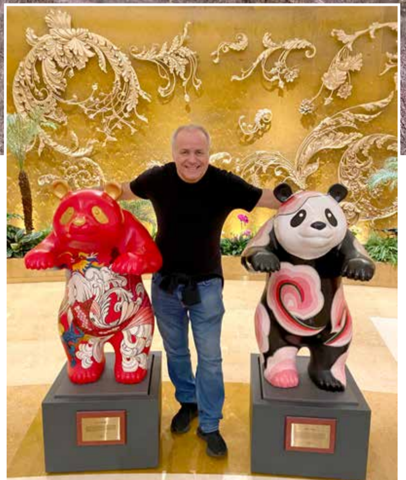
Panda je od druhé poloviny 20. století také národním symbolem Číny a je zobrazena na zlatých nebo stříbrných mincích.

ekonomika dosáhla světové úrovně číslo 1 v oblasti výroby, technologie a organizace pracovní síly. Je to nejsilnější a největší ekonomická mocnost světa. Čína nás technologicky předběhla minimálně o 15 let. Čína jede a my se musíme naučit s ní držet krok,“ myslí si Sehnal. Zadavatel/Zpracovatel: Aliance pro budoucnost