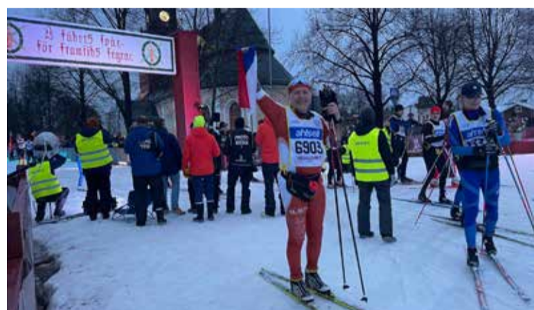
Ocenění si odváží i z běžeckých závodů na lyžích.