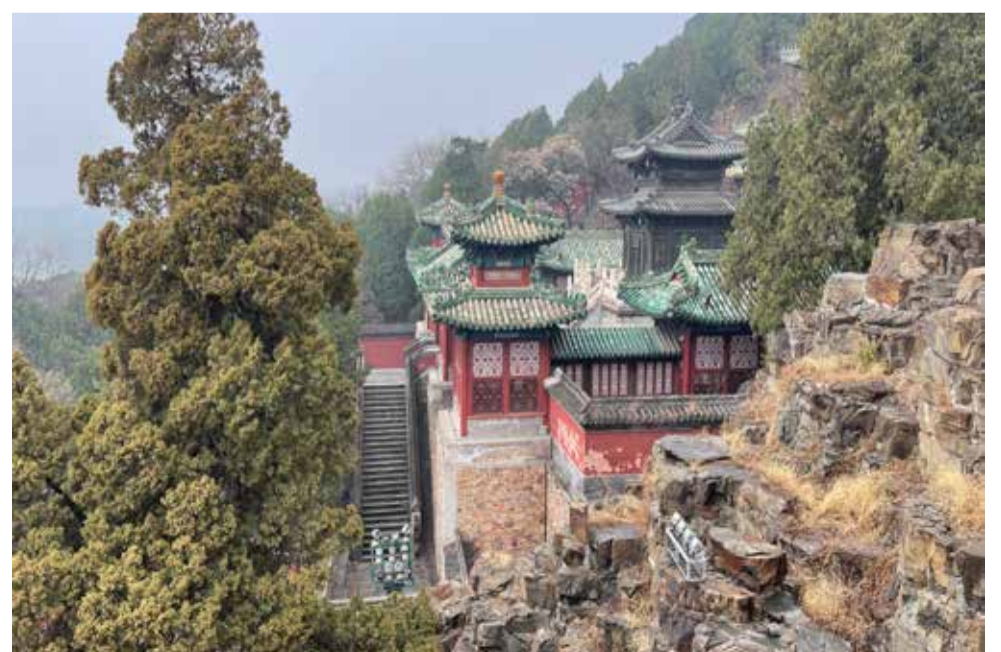
Nezaměstnanost v Číně je vysoká. Hodně mladých lidí chodí do buddhistických chrámů modlit se k Budhovi, aby jim zabezpečil dobré pracovní uplatnění.