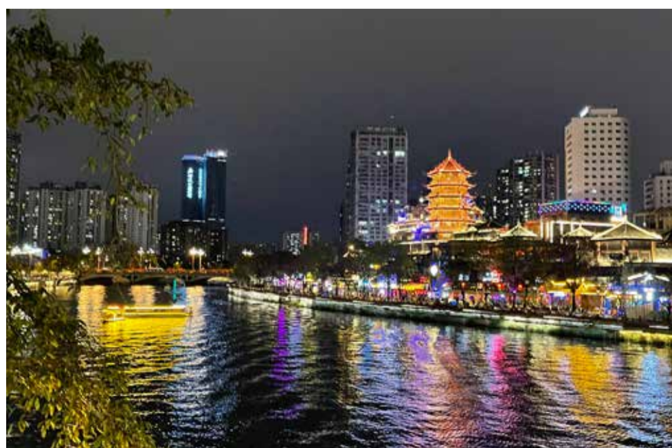
Nejmenší město, které Pavel Sehnal navštívil, má 22 milionů obyvatel. Google nebo Facebook jsou po celé Číně zakázány, cenzura je maximální.