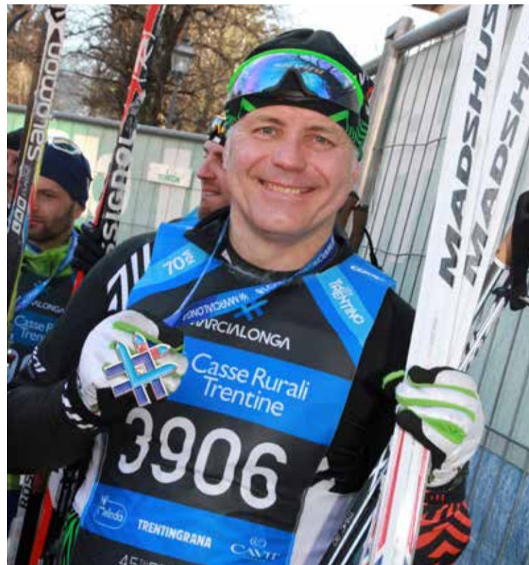
Marcialonga 75 km.

Zadavatel/Zpracovatel: Aliance pro budoucnost