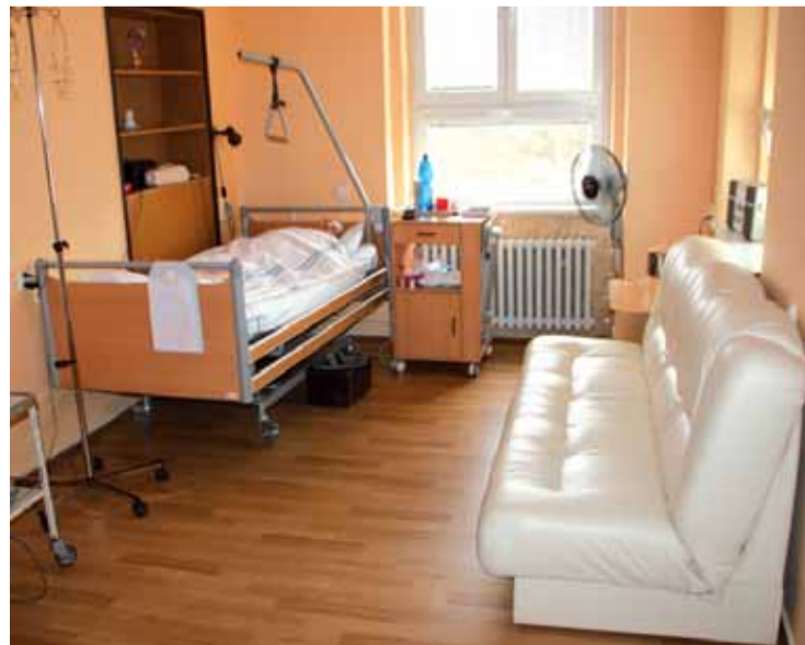
Vybavení nadstandardních pokojů

rozložení WC žen a mužů, koupelen a nové čistící komory), ale také úpravy povrchů podlah a stěn. Došlo také k výměně sociálního vybavení a součástí rekonstrukce byla i výměna osvětlovacích a topných těles. Lůžková část ortopedického oddělení tak „prokoukla“. Pěkné prostředí tak získali pacienti i zaměstnanci. Je samozřejmostí, že všechny tyto změny něco stojí. Významným partnerem při obnově a rozvoji chomutovské nemocnice se i v letošním roce staly Severočeské doly, a. s., které na rozvoj nemocnice přispěly nemalou částkou ve formě sponzorského daru. (kzch)