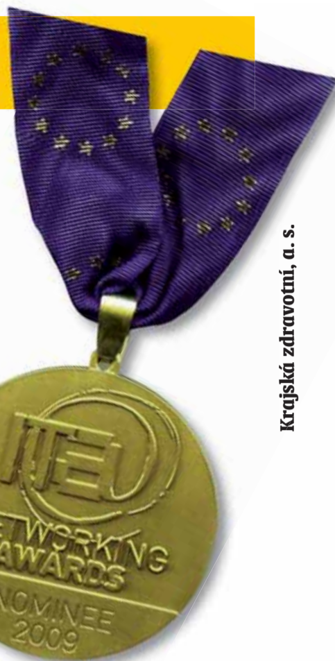
Krajská zdravotní, a. s.

Ojedinelost daného řešení spočívá na koncepčním přístupu při budování regionální informační a telekomunikační infrastruktury pro elektronizaci zdravotnictví, opírající se o nejlepší praxi v oboru, o využití otevřených