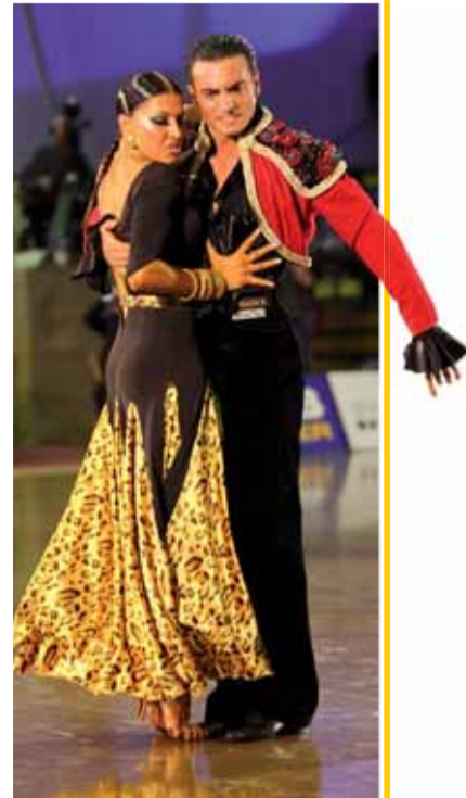
Text: Lucie Sinková