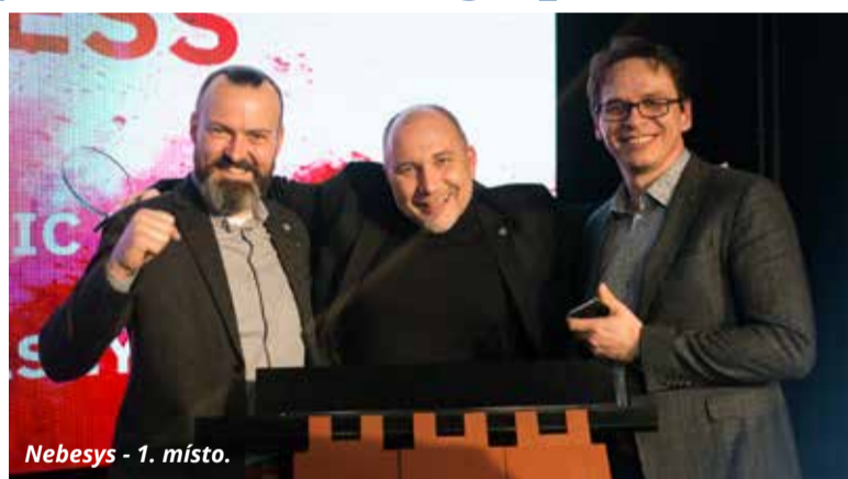
Nebesys - 1. místo.

A jak že vypadala finálová desítka? Ústecký kraj, potažmo Inovační centrum Ústeckého kraje, reprezentoval projekt Rowingo, jedinečný veslařský simulátor, který věrně napodobuje veslování