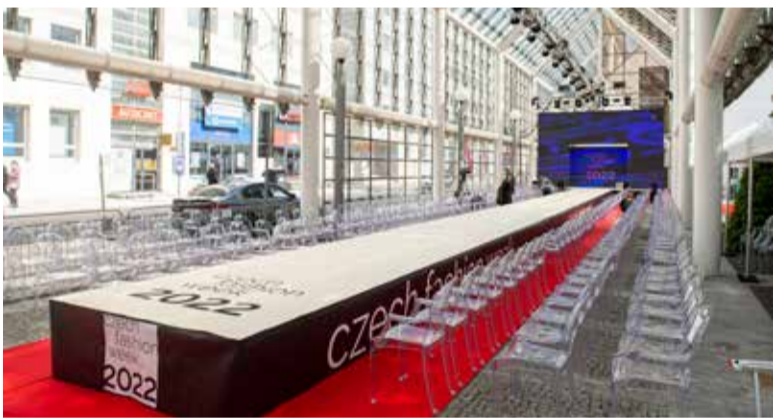
Dějiště módní show Czech Fashion Week Teplice 2022.