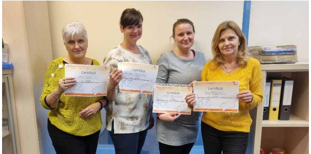
Pracovnice Krajského úřadu Ústeckého kraje v Ústí nad Labem s certifikáty o absolvování školení před otevřením registračního místa Portálu pacienta Ústeckého kraje.

Portál pacienta Ústeckého kraje dala v závěru roku 2022 k dispozici obyvatelům regionu Krajská zdravotní, a.s. (KZ). Služba připravená ve spolupráci s Ústeckým krajem, která je přístupná na webové adrese portal.kzcr.eu , má od 13. března 2023 registrační místo také na podatelně Krajského úřadu Ústeckého kraje v Ústí nad Labem. Občanům služba umožňuje vzdálený přístup k objednávkám zdravotních služeb (rezervaci termínu) ve zdravotnických zařízeních, a to i bez nutnosti předchozí registrace.