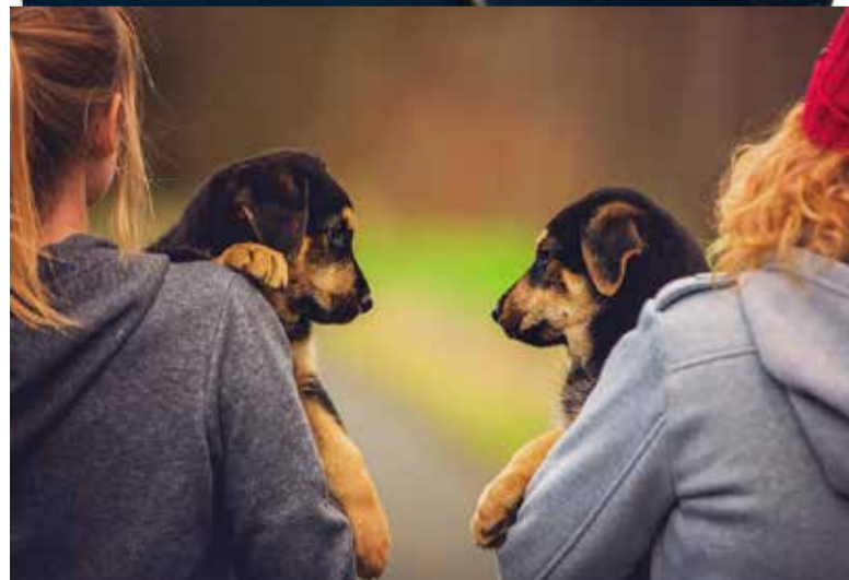
Čekají na novy domov...