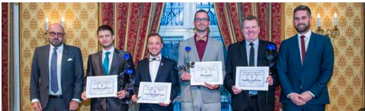
Uděleny byly také zvláštní ceny poroty ankety za dlouholetou činnost.