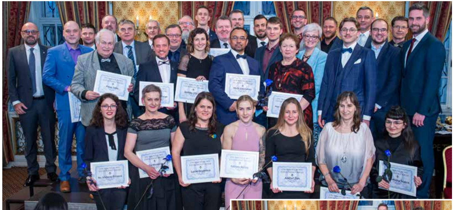
Všichni ocenění i partneři ankety si slavnostní večer náležitě užili.