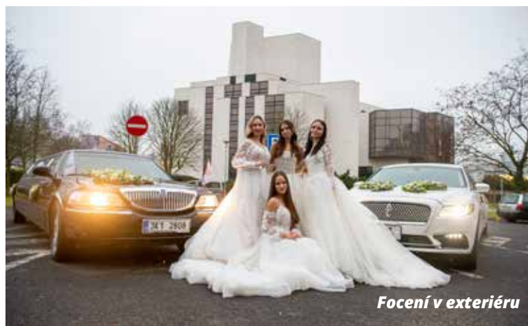
Focení v exteriéru

který si můžete dovolit. Šaty a doplňky svatečnanům většinou půjčujeme, starší modely si pak mohou zákaznice zakoupit v chomutovském salonu.