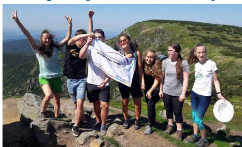
Expedice DofE - studenti Gymnázia FX Šaldy Liberec.

„Liberecký kraj s programem DofE uzavřel v roce 2020 Memorandum o spolupráci. Do programu je nyní zapojených osm škol, které kraj zřizuje. Jsem rád, že žáci mají o program zájem a věnují se tomu, co je zajímavé. Učí se nový cizí jazyk, rozvíjejí prezentační dovednosti, hrají na hudební nástroje. Mohou se zlepšit v běhání či týmových sportech. Oblast dobrovolnictví je součástí programu, ve kterém se zapojují do pomoci svému okolí. Zkrátka se lépe připravují na budoucí profesní život,“ říká Jiří Čeřovský, náměstek hejtmána Libereckého kraje pro školství, mládež, tělovýchovu a sport.