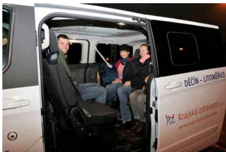
Lékařům a sestřím děčinské chirurgie je pro přesun k operacím v nemocnicích v Litoměřicích a Rumburku k dispozici vozidlo Krajské zdravotní, a.s.

„Přesun operativy je nezbytný z důvodu nové výstavby a rekonstrukce děčinské nemocnice. Krajská zdravotní investuje nejen zde, ale ve všech svých sedmi nemocnicích, to vše s jediným cílem – poskytnout pacientům a zaměstnancům co nejlepší péči a prostředí,“ řekl MUDr. Petr Malý, MBA, generální ředitel KZ. První etapa výstavby v Děčíně zahrnuje částku vyšší než 780 milionů korun. Práce obsahují demolici starých objek-