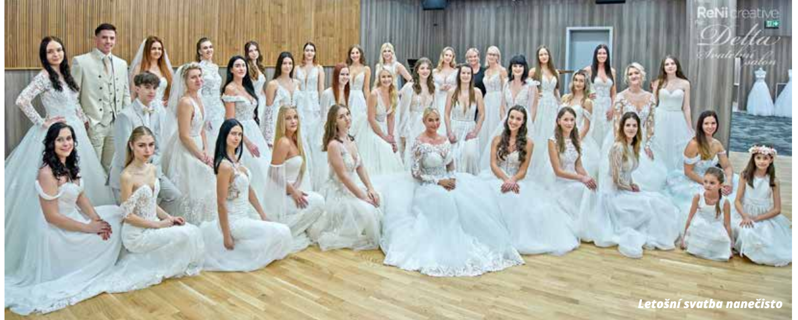
Letošní svatba nanečisto

Jsou to velmi rozmanité styly, stále více párů volí kromě osvědčených míst