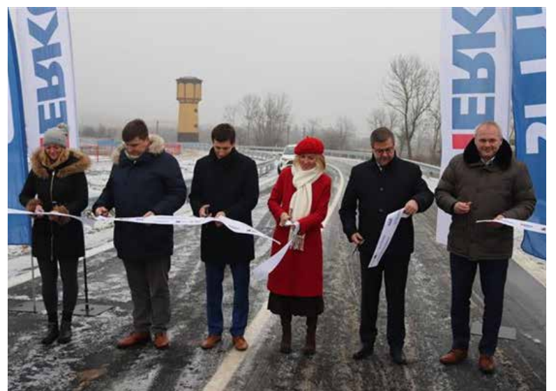
Snímek je ze slavnostního otevření obchvatu.

188 825 844 Kč si zažádal letos. Cílem vybudování nové komunikace bylo vymístění tranzitní dopravy, která využívá stávající silnici III/00732, z centra Chomutova. Nová silnice odvádí nákladní dopravu z lokality městské části Zadní Vinohrady. Zároveň odlehčuje dopravě v ulicích Čelakovského, Moravská, Mostecká a části ulice Vinohradská a dojde ke snížení tranzitní dopravy v obci Otvice. Tyto změny mají příznivý dopad na snížení imisní zátěže v Chomutově. (od dop.)