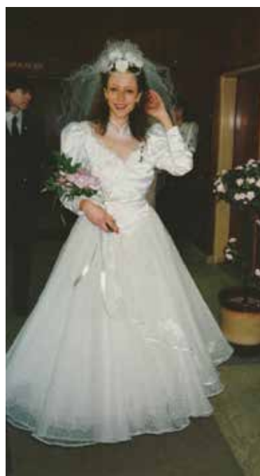
První nevěsta Svatebního salonu Delta před 30 lety.