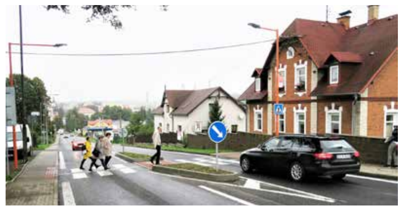
Nový oranžový přechod v Pražské ulici v Rumburku.

Nové Oranžové přechody mají nebo budou letos ještě do konce dubna zrealizovány v Kostomlatech pod Milešovkou, Bílíně, Rumburku, Údlících a Újezdečku. Od roku 2013 přitom nadace podpořila 34 projekty v Ústeckém a 5 v Libereckém kraji. Slovo projekt je přitom na místě, neboť někde dokázali, například v Postoloprtech, Krupce, Kadani a Teplících nasvítit i více přechodů najednou. Nadace ČEZ je největší firemní nadací v České republice. Za 20 let své existence podpořila napříč regiony v průměru přes 750 projektů za více než 160 milionů ko-