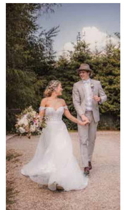
Mnoho párů dává přednost obřadu v přírodě.