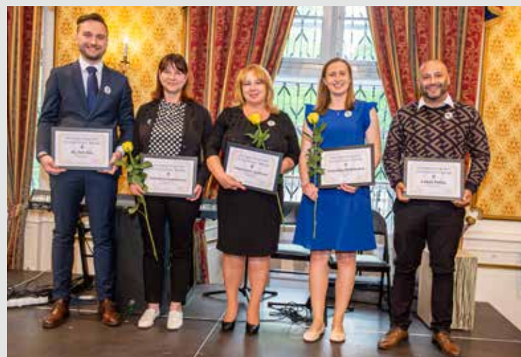
Vítězové jednotlivých kategorií Osobnost roku 2021 Ústeckého kraje.