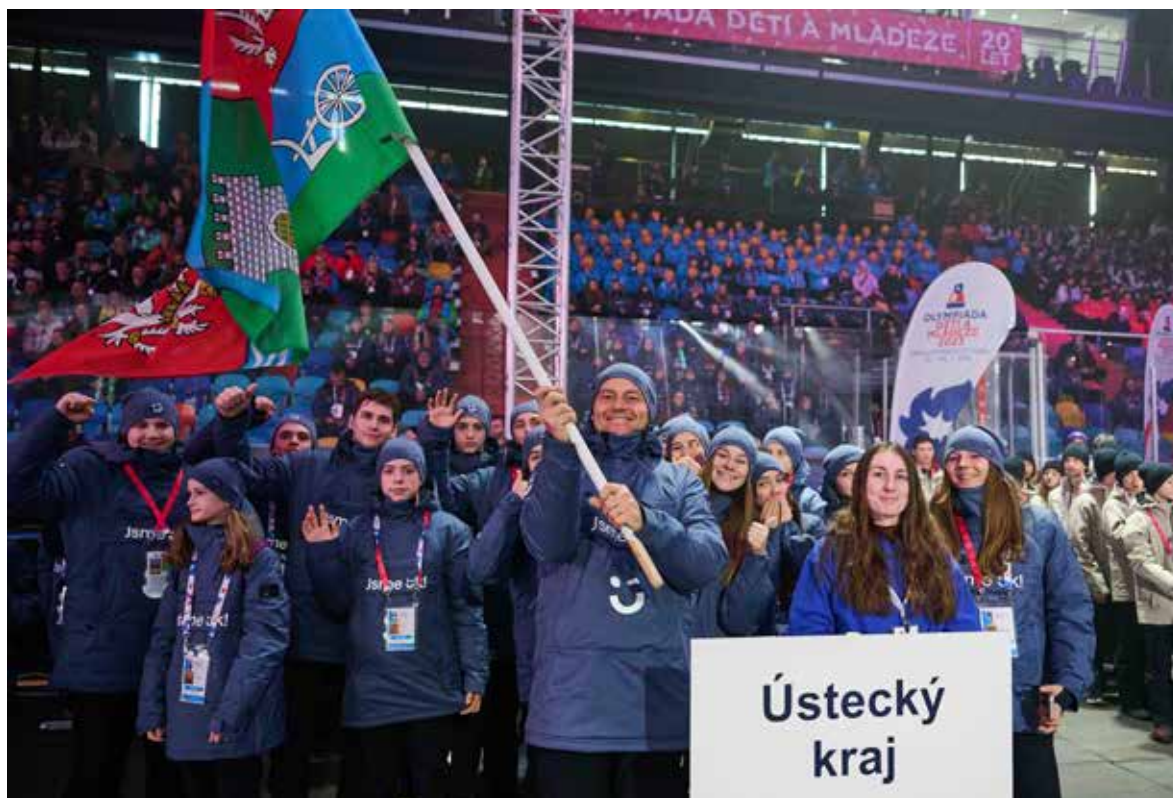
Ústecké sportovce přivedl na zahájení Tomáš Kraus.

Na sportovištích i v samotných městech to žilo. „Měl jsem možnost s mnoha mladými sportovci mluvit a říkali, že si to v Královéhradeckém kraji neuvěřitelně užili. Navíc tato edice patřila k těm nejúspěšnějším i co se týká návštěvnosti sportovišť. Například na hokeji i ve Vejšplachách bylo každý den téměř tisíc návštěvníků, což je pro mladé sportovce fantastický zážitek,“ komentuje Filip Šuman, místopředseda Českého olympijského výboru zodpovědný za ODM. Sportoviště i Olympijský dům každý den navštěvovali kromě veřejnosti rovněž školy a desítky úspěšných sportovců. Mezi nimi nechyběla ambasadorka Eva Adamczyková, biatlonista Ondřej Moravec, alpská lyžařka Martina Dubovská, snowboardista Jakub Hroneš, skikrosář Tomáš Kraus, hokejista Václav Varaďa, Patrik Eliáš, Matouš Menšík a další.