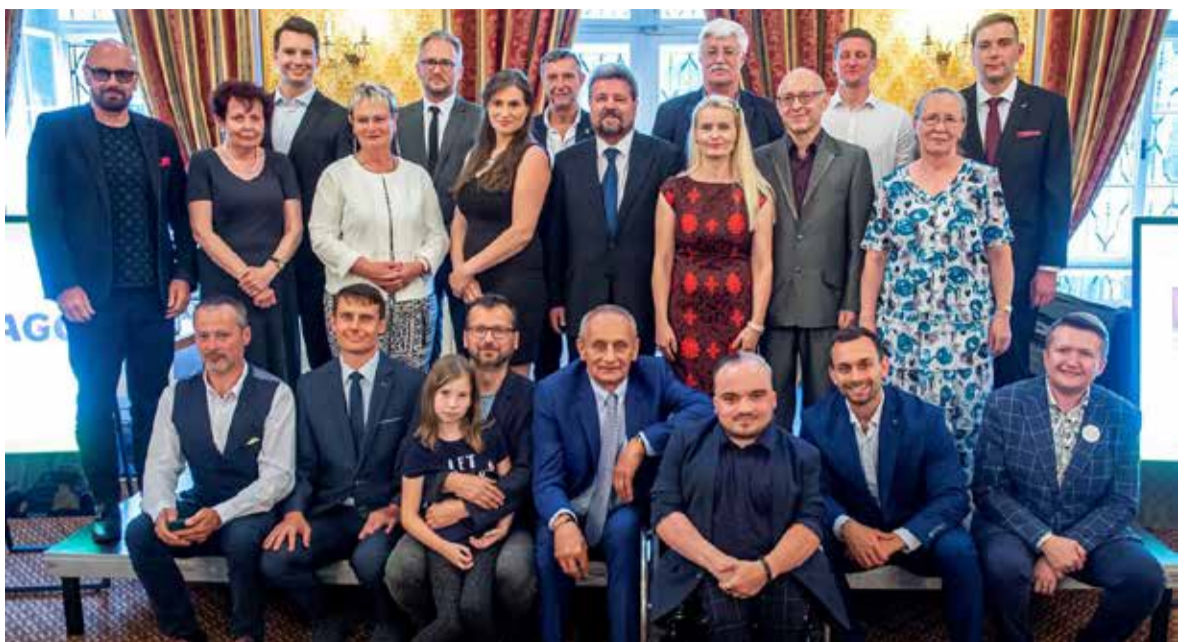
Vítězové ankety z roku 2020 s pořadateli.