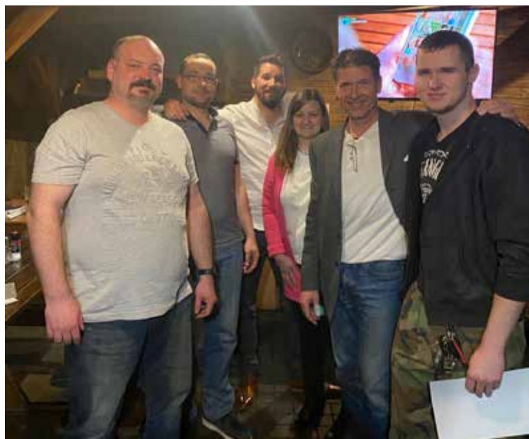
Nejlepší zlepšovatelé závodu KI Krupka za rok 2021.

Za procesem zlepšování v KI jsou desítky hodin věnovaných školení správné praxe, provádění vrstvených auditů na jednotlivých pracovištích, využívání nástrojů Lean a Six Sigma. Jde se do kořenových příčin problémů. Trvalé zlepšování je proces, stojí na lidech a je formulován dvěma principy – zapojování a delegování. Na jedné straně je odvaha managementu, dát lidem důvěru, svobodu je nechat dělat věci po svém. Vést je jen firemními hod-