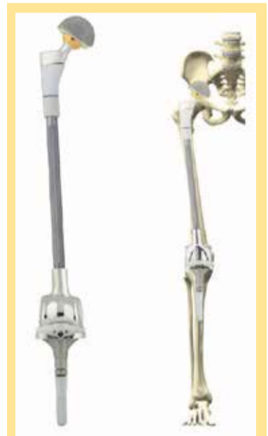
Implantát k totální náhradě stehenní kosti.

ORTOPEDICKÁ KLINIKA FAKULTY ZDRAVOTNICKÝCH STUDIÍ UNIVERZITY J. E. PURKYNĚ V ÚSTÍ NAD LABEM A KRAJSKÉ ZDRAVOTNÍ, a. s. – MASARYKOVY NEMOCNICE V ÚSTÍ NAD LABEM, o. z.