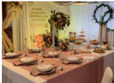
Slavnostní tabule, jak má být.