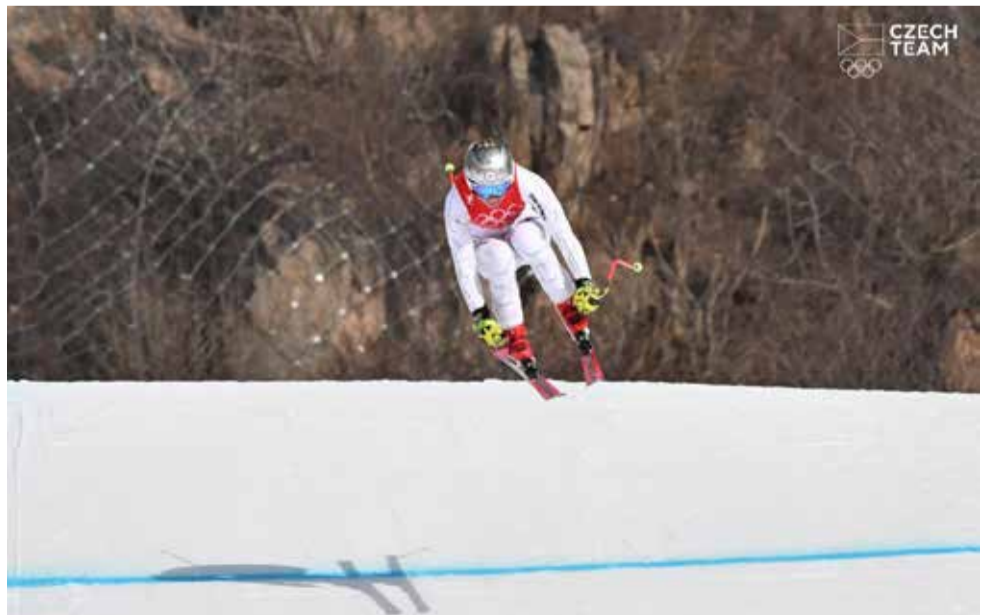
Páté místo za super-G.