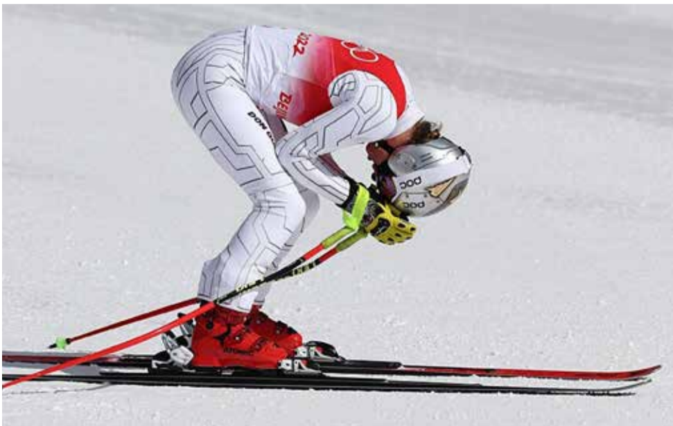
Zklamání za nevydařenou jízdu ve sjezdu.

Narodila se 23. března v roce 1995 v Praze. Vyrůstala ve slavné rodině, jejím otcem je populární zpěvák a skladatel Janek Ledecký, dědečkem hokejista Jan Klapáč a starší bratr Jonáš Ledecký je úspěšný umělec. Ten mimo jiné své sestře vymyslel superhrdinskou identitu a navrhl design pro její kombinézu a snowboard. Ester Ledecká jako jediný sportovec na světě vyhrála na jedné zimní olympiádě ve dvou různých sportech. Letos do své sbírky přidala už třetí zlatou olympijskou medaili.