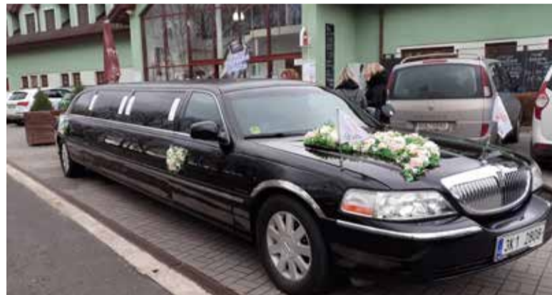
Novomanželé se mohou svézt nazdobenou limuzinou.