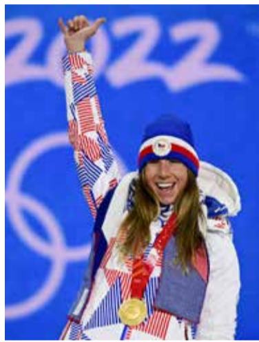
Zlatá medaile za jízdu na snowboardu.

Jiří Šindelář , bývalý snowboardista a český olympionik: „Nikdy jsem nepoznal větší talent. Už před závodem v paralelním obřím slalomu vyprávěl, že by se muselo stát něco mimořádného, aby