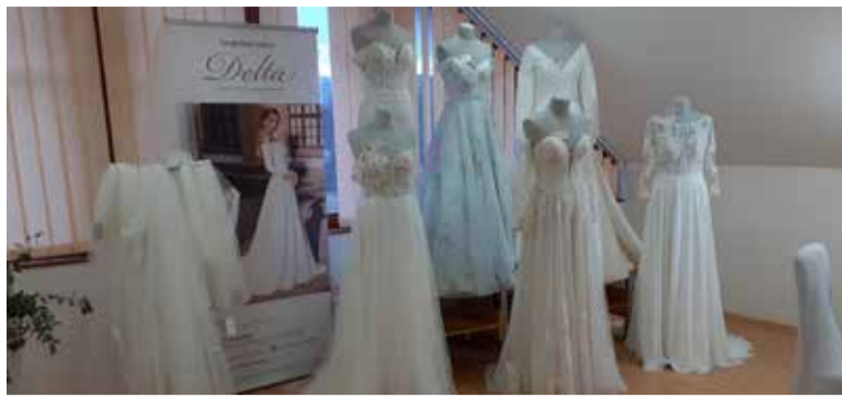
Ve Svatebním salonu Delta v Mostě a v Chomutově si vybere každá budoucí nevěsta. Obléknou v něm ale i ženicha a svatebčany.