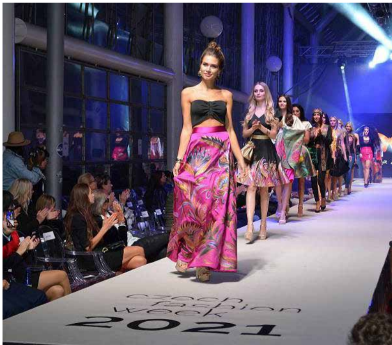
Czech Fashion Week 2021 - Teplice.

ných hostů a návrhářů do lázeňského města, dohodli se na spolupráci i předběžném termínu konání. Ten je stanoven na sobotu 17. září 2022. Kromě Teplic se letos Czech Fashion Week uskuteční také v hotelu Imperial v Karlových Varech a na hradě Špilberk v Brně. (red.)