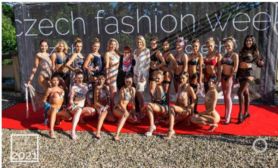
Luxusní spodní prádlo Le Chaton.