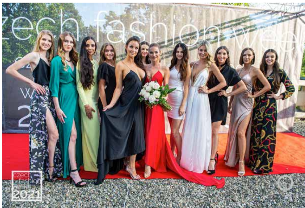
Značka Andy Vendy.