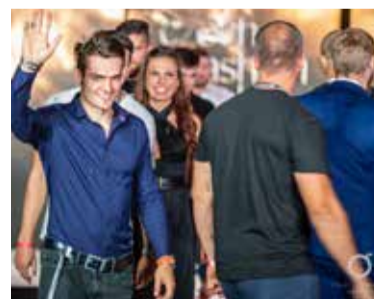
Závěrečné defilé realizačního týmu.