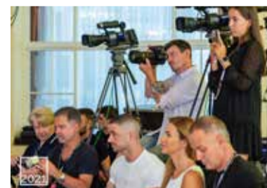
Četní zástupci renomovaných médií byli ve střehu.

//////////////////////////////////// Děkujeme všem partnerům a sponzorům //////////////////////////////////