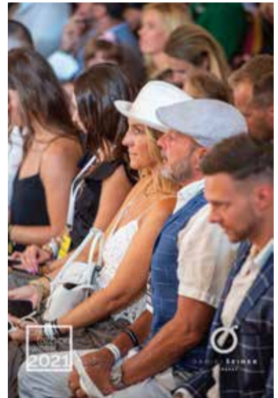
Publikum hlava na hlavě.