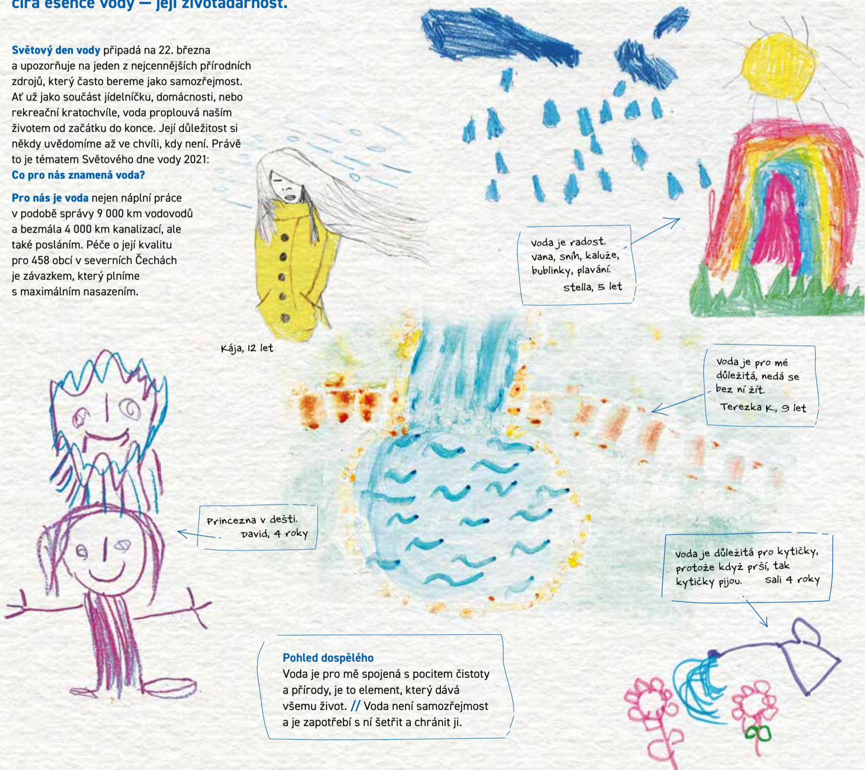
Kája, 12 let

Pro nás je voda nejen náplní práce v podobě správy 9 000 km vodovodů a bezmála 4 000 km kanalizací, ale také posláním. Péče o její kvalitu pro 458 obcí v severních Čechách je závazkem, který plníme s maximálním nasazením.