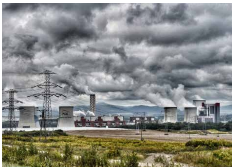
Ilustrační foto dolu Turów

„Mým úkolem je nyní zajistit ve spolupráci s Ministerstvem životního prostředí veškeré potřebné podklady nutné k podání žaloby společně s návrhem na vydání předběžného opatření na Polskou republiku za porušení rádných postupů v rámci platné legisla-