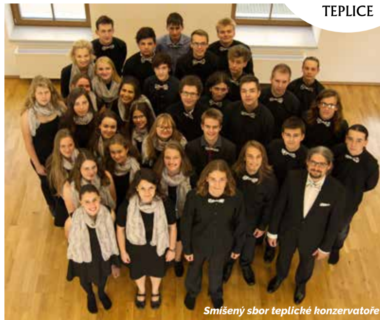
Smíšený sbor teplické konzervatoře

Díky vstřícnosti vedení orchestru probíhá v dvou rovinách. Nejlepší žáci a studenti se mohou představit jako sólisté či dirigenti na každoročním slavnostním koncertě SČF Teplice „Severočeská filharmonie představuje mladé umělce teplické konzervatoře“, v případě skladatelů může být provedeno jejich dílo. Pro mladé umělce, kteří stojí na začátku kariéry, jde o zcela výjimečnou unikátní příležitost. Druhou formou spolupráce je dlouhodobější projekt s názvem Orchesterální akademie, která umožňuje žákům a studentům zapojit se do reálného provozu profesionálního orchestru včetně zkoušek i koncertu před vyprodaným hledištěm. To je z našeho pohledu nenahraditelná zkušenost.