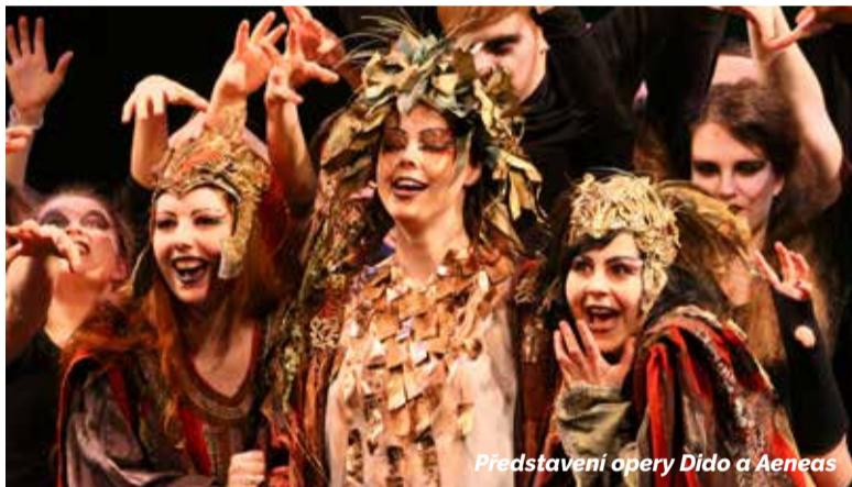
Představení opery Dido a Aeneas

Připravila: L. Richterová