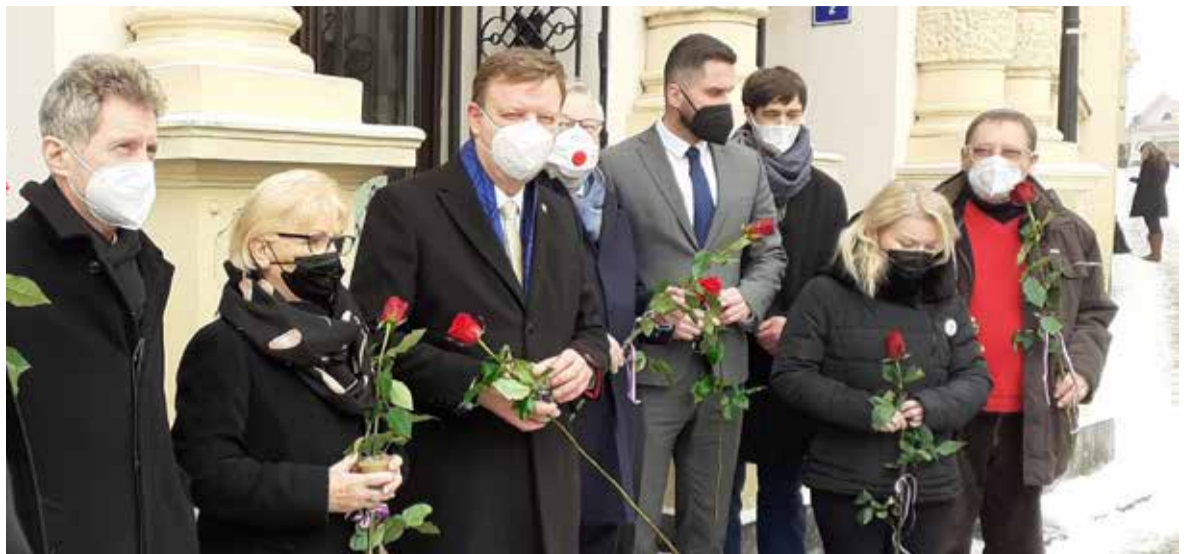
Účastníci vzpomínkového setkání na počest nedžitých narozenin Jaroslava Kubery