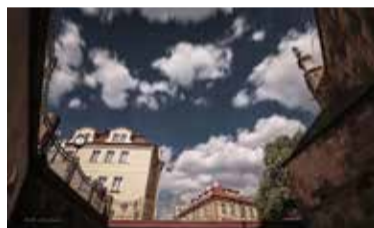
Nebe nad liduprázdnou Prahou

ku 2018, mne přepadla touha více fotit, pořídil jsem si poloprofesionální Nikon d7500 a začal se učit a postupně se do toho dostávat. Loňský rok byl pro mně co se týče fotografování a zdravotního stavu hodně náročný. Věnovat se fotografování na 100 procent jsem začal teprve od letošního roku, plány ale ohrozil koronavirus.