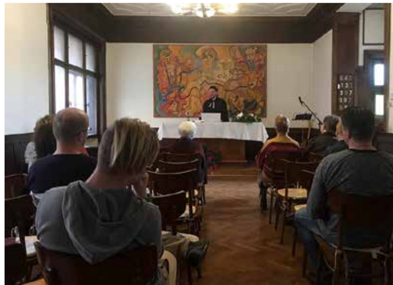
Modlitebna na faře ve Dvořákové ulici v Ústí nad Labem.