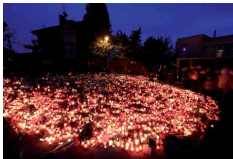
Do ulice Nad Bertramkou přicházeli lidé i za tmy