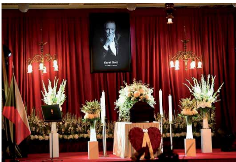
Pietní místo na Žofíně

Veřejnost se s ním loučila hned na několika stanovištích. Před vilou v ulici Nad Bertramkou, kde řadu let bydlel, v Zahradě Kinských pod Petřínem a na Žofíně, kam v pátek 10. října během dne dorazilo téměř 50 tisíc fanoušků z Čech i ze zahraničí. Na pohřbu se státními poctami se u mikrofonu vystřídali kardinál, primas český Dominik Duka, kněz Zbigniew Czendlik, herci Jiřina Bohdalová, Dagmar Havlová, Jiří Bartoška a zpěváci kolegové Eva Pilarová, Eva Urbanová, Lucie Bílá, Štefan Margita, Vojtěch Dyk a také ošetřující lékař a sestry nemocnice na Karlově náměstí, kteří o vážně nemocného umělce poslední čtyři roky pečovali. Rakev s ostatky zemřelého vyprovodili diváci na 3. nádvoří Pražského hradu dlouhotrvajícím potleskem. Pietní místa k uctění památky Karla Gotta vznikla na mnoha místech naší republiky, kde lidé měli možnost zapsat se do kondolenčních knih. Karel Gott podlehl akutní leukémii. Skonal doma v kruhu rodiny v úterý 1. října. Bylo mu 80 let. Čest jeho památce!