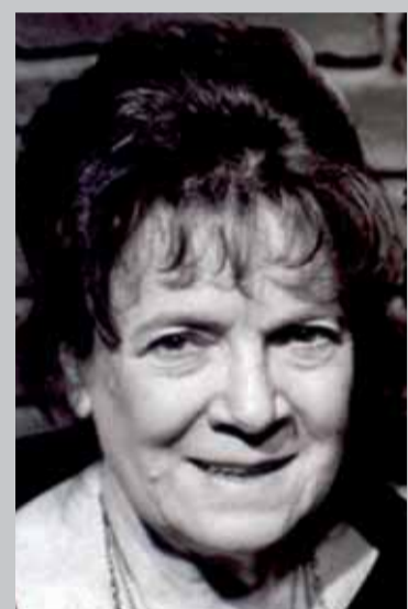
Vlasta Chramostová zemřela doma ve spánku ve věku nedožitých 93 let v neděli 6. října. Čest její památce!