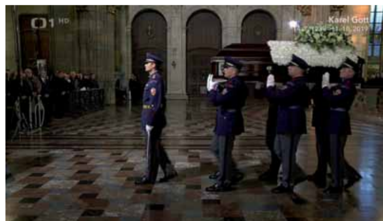
Čestná stráž vynáší rakev s ostatky Karla Gotta z katedrály