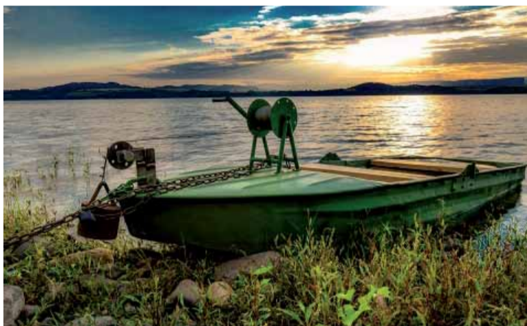
Rybářská loď na Nechranské přehradě – vítězný snímek 4. ročníku soutěže v roce 2018, autor Martin Matajzík.

Doplňující informace k fotosoutěži: Do soutěže jsou přijímány pouze digitální fotografie ve formátu jpg s maximální velikostí 5 MB a minimálním rozlišením 2480x1748 px. Maximální počet snímků od jednoho autora je 10. K fotografii nezapomeňte připojit kontaktní údaje (jméno, e-mail, případně telefon) a ideálně i stručný popis místa. (od dop.)