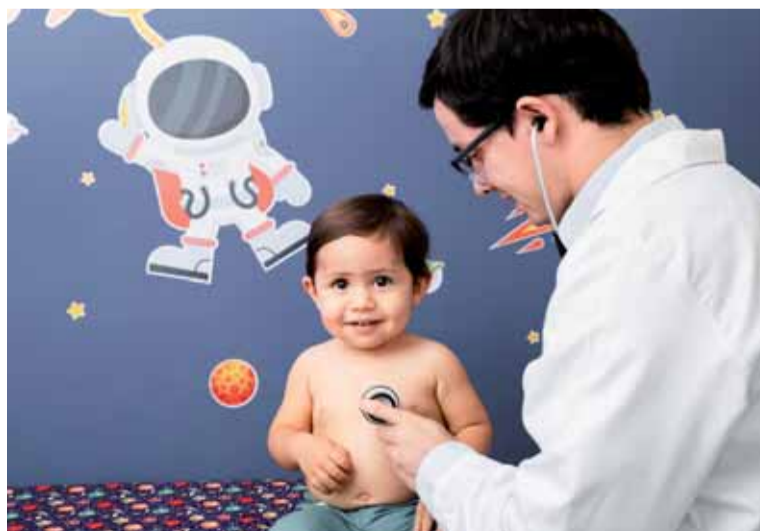
I o nejmenší pacienty je v nemocnicích dobře postaráno

Podrobnosti a přihlášku do stipendijního programu Nadačního fondu Krajské zdravotní, a.s. naleznete na www.kzcr.eu/cz/kz/verejnost/nadacni-fond/ . Uzávěrka 1. kola je 31. 10. 2019