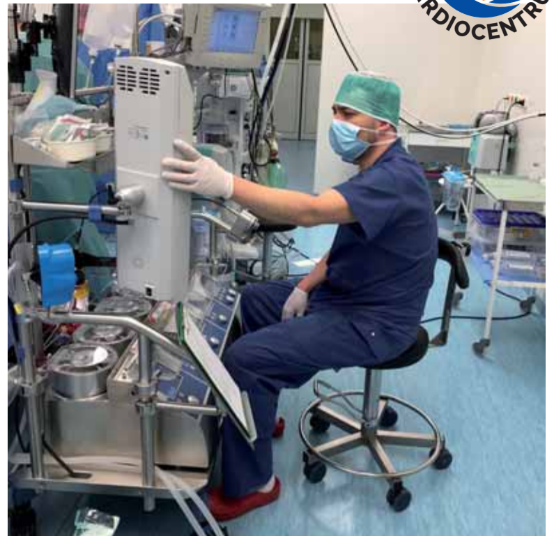
Na sále během kardiochirurgické operace

Přístroj umožňuje dočasné odklonění toku krve od srdce a plic, jejichž funkce je potřeba po dobu operačního výkonu nahradit, aby se mohlo na srdci pracovat v operačním poli, ideálně bezkrevně. Skládá se z několika čerpadel, tzv. konzol, k nimž