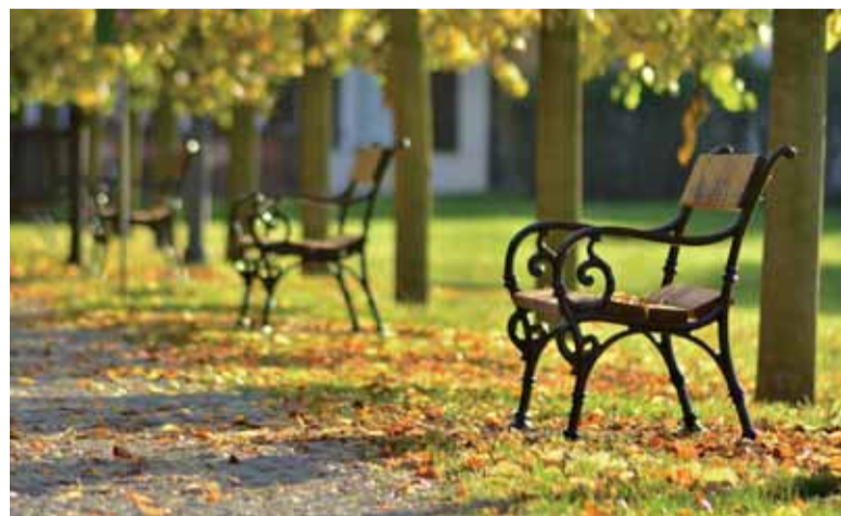
Podzim začíná

Posledních pár dní mají fotografové na to, aby rozšířili své sbírky o podzimní snímky Dolního Poohří. Soutěžní fotky musí dorazit nejpozději do 31. října na e-mailovou adresu info@dolnipoohri.eu. Porota z nich poté vybere sérii těch nejlepších, a to jak v kategorii dospělých, tak dětí. Na vítěze čekají zajímavé fotografické ceny. Jejich snímky budou provázet návštěvníky Dolního Poohří po celý rok, ať už na kalendářích nebo v propagačních materiálech.