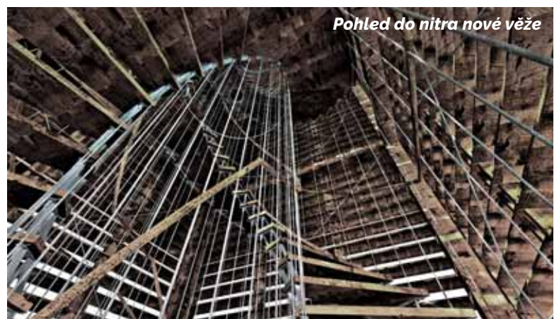
Pohled do nitra nové věže

Šikmá věž kostela Nanebevzetí Panny Marie se ve svých šedesáti metrech výšky odklání od vertikály o více než dva metry. Je nešikmější věží v České republice i daleko za hranicemi okolních států. Ke svému handicapu přišla za druhé světové války, po zásahu leteckou pumou se naklonila a praskla. Tehdy to vypadalo, že brzy spadne. Později ji ale Ústečané podepřeli dřevěnou konstrukcí a nakonec byla sloužit zajištěna pomocí betonové injektá-