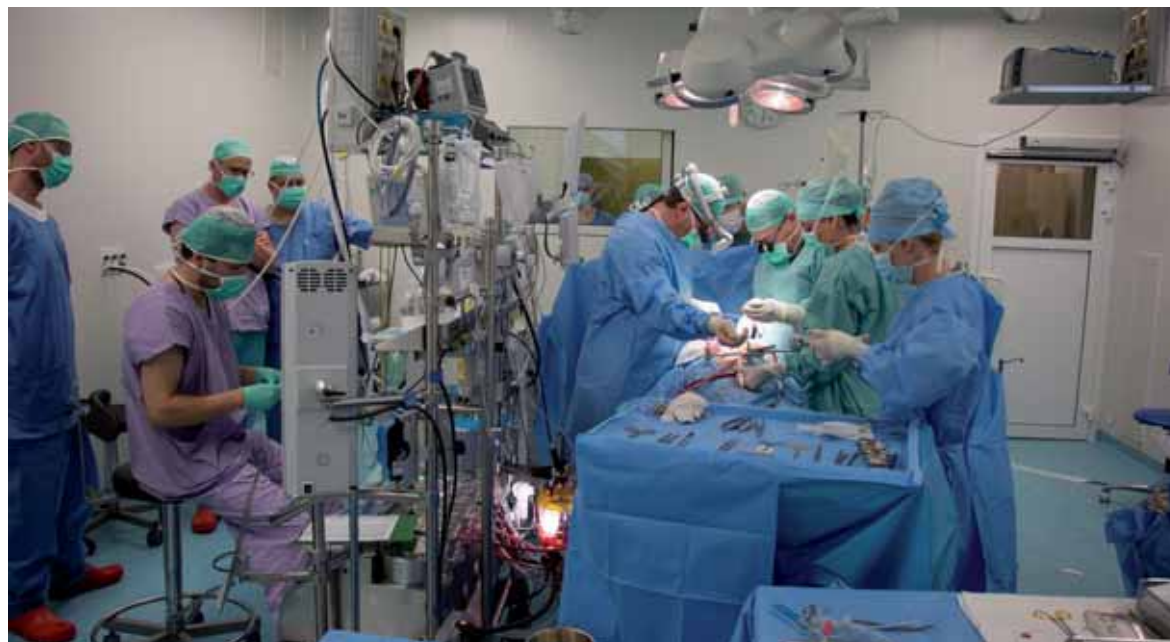
Při náročných operacích musí být tým dobře sehraný

„Chtěla bych poděkovat všem lékařům a zdravotním sestřím, které se na mě léčbě podílely. Cítím se, co se týká srdíčka a urologických potíží, dobře. Jsem ráda, že jsem by-