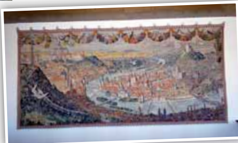
Cyril Bouda: Praha, matka měst