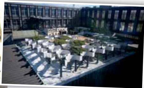
Terasa 60. léta, bruselský styl

šich evropských zlatých pokladů, který mimo jiné čítá 2 900 zlatých mincí a celková váha zlata dosahuje téměř třinácti kilogramů. K 20. výročí pádu komunistického režimu Národní muzeum připravilo výstavu Be Free, kterou otevřelo 17. listopadu. Letos se tady také ještě chystá výstava Olympionici.