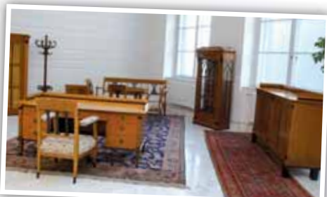
Nábytek předsedy národního shromáždění