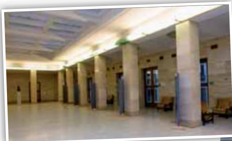
Předsálí burzovních sálů

Praha | Donedávna byla budova sousedící s Národním muzeem obestřena tajemstvím. Na nepříliš pohledné dílo architekta Karla Pragra si nejdřív musela veřejnost dlouho zvykat. Pak ho přijala jako běžnou součást Václavského náměstí. Vnitřek budovy ale ještě donedávna znal jen málokdo.