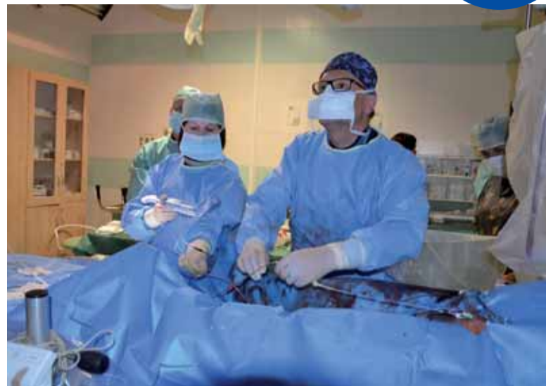
Kardiozákrok TAVI + MitraClip, tedy výměnu dvou srdečních chlopní najednou, provedl tým kardiokliniky v ústecké Masarykově nemocnici jako první ve střední a východní Evropě

Tým kliniky ročně ošetří více než čtyři tisíce pacientů. Klinika zahájila jako jedna z prvních v České republice katetrizací léčbu nedomykavosti mitrální chlopně, vybrána byla samotným výrobcem tohoto zařízení k provádění těchto výkonů. Je jedním ze čtyř takto specializovaných pracovišť v ČR. V roce 2016 pracoviště jako první ve střední a východní Evropě provedlo perkutánní simultánní zákrok na dvou chlopních. Lékaři kliniky provedli perkutánní implantaci chlopně do aortální pozice (TAVI) s protekcí možné embolizační mozkové příhody pomocí speciálního nového zařízení – Claret CE ProTM. Šlo o první použití tohoto zařízení v ČR. Pro TAVI (katetrizací implantace aortální chlopně), což je nová metoda, která umožňuje léčbu nemoc-