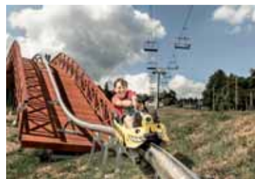
Mezi nominovanými je také bobová dráha na Klinech.

• Vyhlídka elektrárny Ledvice - od dubna 2018 je návštěvníkům k dispozici prosklená vyhlídka s přístupným ochozem ve výšce 144 metrů na nejvyšší průmyslové stavbě v České republice.