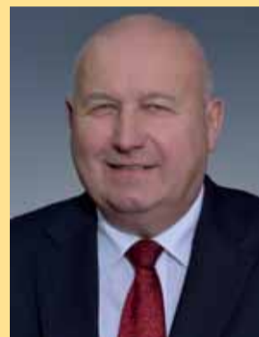
Oldřich Bubeníček, hejtmán Ústeckého kraje

radiofrekvenční ablace komplexních arytmií či krátkodobé podpory oběhu). Každým rokem je katetrizováno 2300-2500 nemocných a provedeno více jak 1000 léčebných zákroků. Kromě tohoto počtu je část nemocných (340-420) odesílána každoročně na pražská pracoviště k různým typům kardiologických výkonů (nejčastěji k revaskularizaci myokardu). Za období 2005-2015 to bylo 4294 nemocných. Nutno podotknout, že se jedná ve většině případů o elektivní výkon. Okolo 5 akutních nemocných však každým rokem umírá ještě před nebo během transportu. I když se za posledních 15 let podařilo snížit úmrtnost na kardiovaskulární choroby v rámci celé ČR i Ústeckého kraje, podle statistiky ÚZIS stále patří Ústecký kraj mezi regiony s nejvyšší mortalitou na akutní i chronické formy ischemické choroby srdeční (ICHS). Také počet hospitalizací pro ICHS je jeden z nejvyšších v rámci celé ČR. Naproti tomu, podle statistiky VZP ČR z roku 2010, průměrné výdaje na jednoho pacienta patří k nejnižším v ČR.