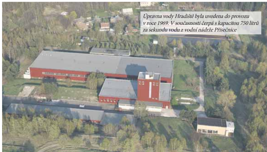
Úpravná vody Hradiště byla uvedena do provozu v roce 1969. V současnosti čerpá s kapacitou 750 litrů za sekundu vodu z vodní nádrže Přísečnice

Cena vody v severočeském regionu odráží reálné náklady spojené s její výrobou, odkanalizováním a čištěním. SVS je největší vodárenskou společností na území ČR a stará se o více než 13 tisíc kilometrů vodovodů a kanalizací. Značnou část této infrastruktury zdědila po roce 1989 v zanedbaném stavu a ročně musíme do obnovy investovat stovky milionů korun – každý rok je to i s opravami kolem 1,6 miliardy korun. To se v ceně, pokud ji města a obce nechťejí