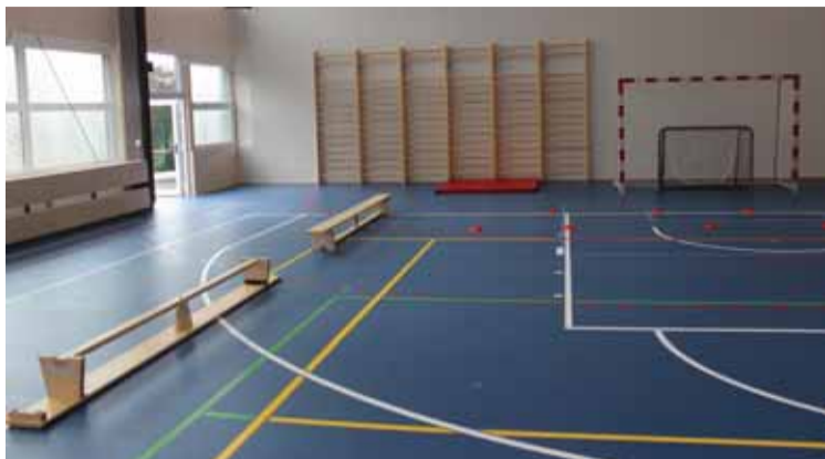
SOŠ a SOU Roudnice nad Labem se pyšní novou tělocvičnou.

Na Střední odborné škole a Středním odborném učilišti v Roudnici nad Labem se žáci i pedagogický sbor dočkali otevření nové zrekonstruované tělocvičny.