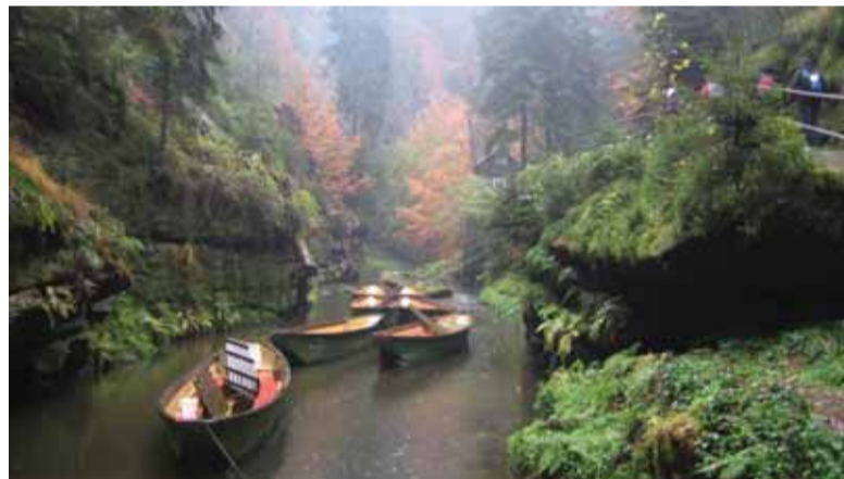
Soutěsky Kamenice v Hřensku jsou první v návštěvnosti v kategorii Přírodní turistické cíle.