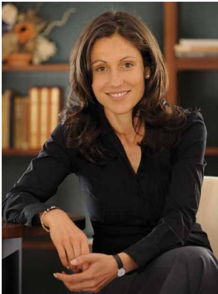
Lídr kandidátky ANO 2011 na primátorku Karlových Varů

Grandhotel Pupp je také místem konání kongresů a konferencí. Díky špatné infrastruktuře a spojení zejména na Prahu máme horší podmínky získávat akce z Prahy, či zahraniční. Klesající trend v této oblasti bychom rádi zastavili a pokusili se do Karlových Varů a do Grandhotelu Pupp navrátit také tento segment našich zákazníků. Je potřeba využít více potenciálu, který Karlova Vary mají, aby město oživalo častěji než jen v době Mezinárodního filmového festivalu.