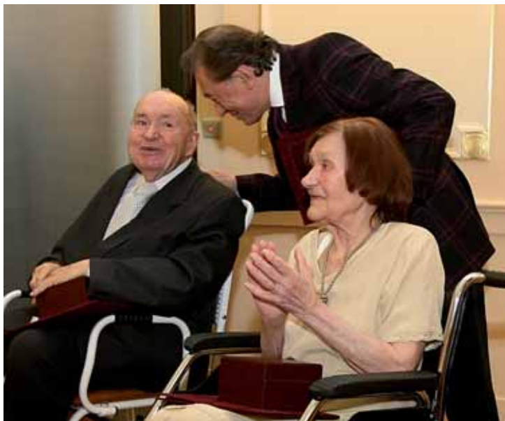
Nové osobnosti ve Dvoraně slávy Plzeňského kraje.