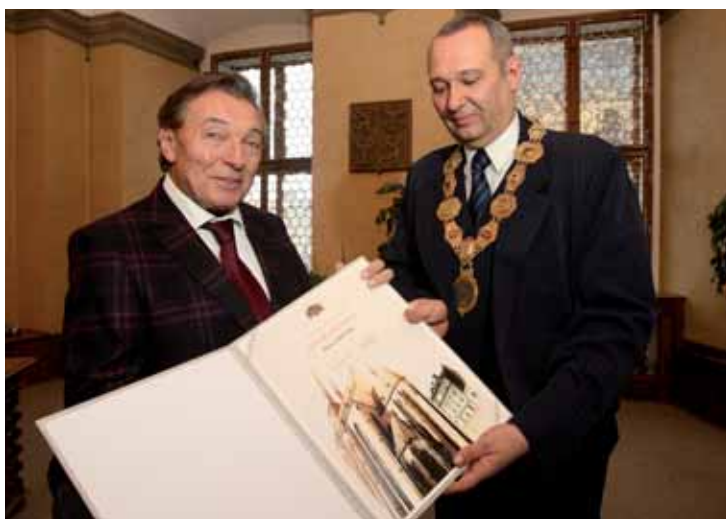
Sedmdesátiletý Karel Gott se stal čestným občanem své rodné Plzně. Nejvyšší městské ocenění převzal od plzeňského primátora Pavla Rödla.

Každou středu od sedmi do jedenácti večer mohou zákazníci klábosit s přáteli a popíjet své oblíbené nápoje za působivého doprovodu živé klavírní hudby při Piano-live večerech. Kavárna a čajovna Kačaba v Prokopově ulici slouží Plzeňanům už čtyři roky. Je to chráněná pracovní dílna, která zaměstnává lidi se zdravotním, převážně mentálním postižením. Pomáhá tak zlepšit jejich pracovní a sociální dovednosti a zvýšit tak šanci na získání pracovního místa a lepší začlenění do většinové společnosti. (vza)