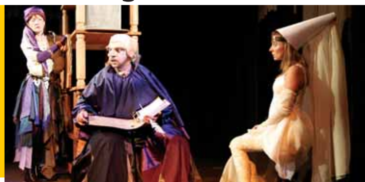
Snímek z inscenace O bílé lani.

Plzeňské Divadlo Alfa patří v zahraničí k nejžádanějším českým profesionálním divadlům. Potvrzuje to i letošní podzim, který je pro Alfou ve znamení významných zahraničních festivalů. V září a říjnu odehrál soubor představení na prestižních akcích ve Francii, Německu a Polsku. V listopadu se chystá znovu do Německa a spolu s Divadlem bratří Formanů na festival do Dánska.