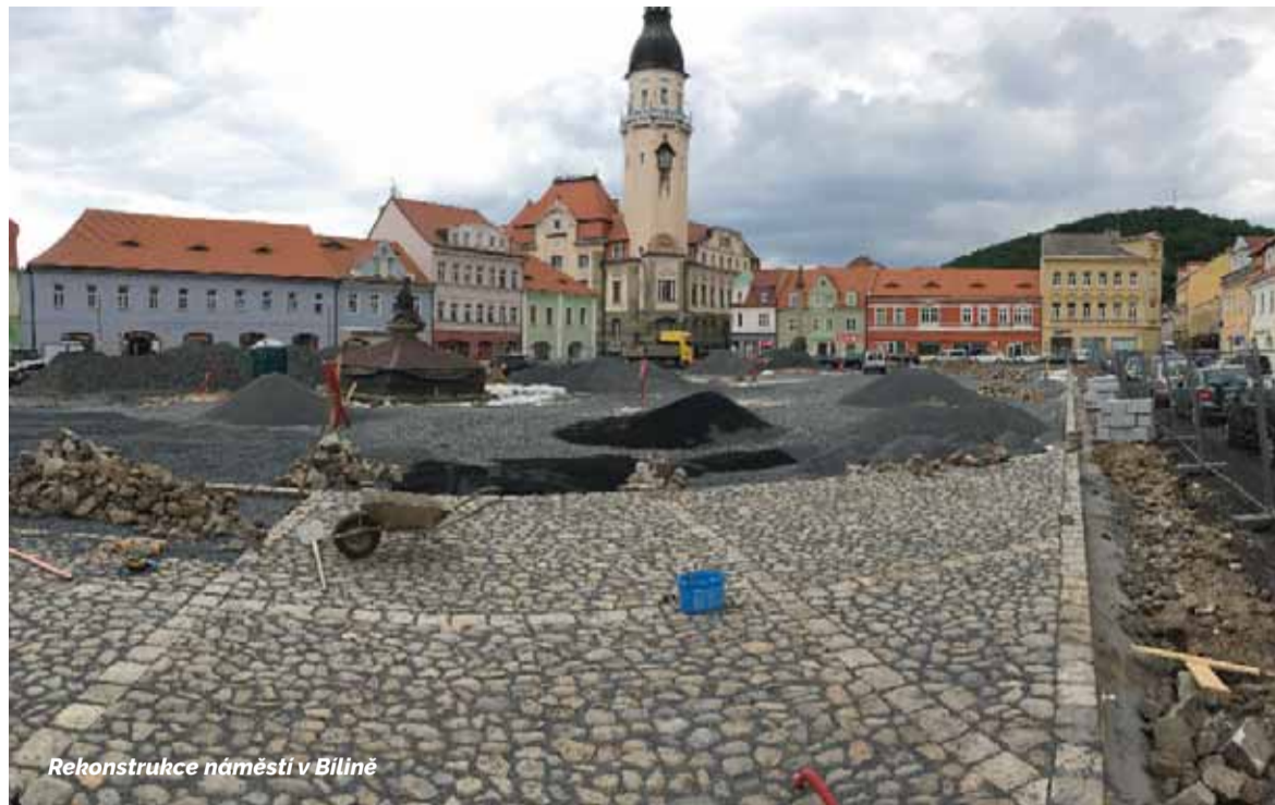
Rekonstrukce náměstí v Bilině

Žádné zásadní změny nenastaly. Na stavebním trhu je stále aktuální otázka volných kapacit. Ty prostě nejsou, s tím se potýkáme dnes a denně. Ruku v ruce s tím souvisí i problém velmi pomalé akcelerace ze strany investorů v oblasti růstu cen. Investoři, když už mají připravené projekty, nereflktují na vývoj trhu a stále kalkulují s cenami, které odpovídají úrovni z před dvou a dokonce někdy i čtyř let. Už jen s ohledem na výrazný růst hodinových sazeb je nemožné tyto ceny nadále investorům držet.