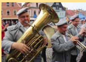
Hudba zněla celým náměstím.

Českokamenický hudební festival má certifikát Rodinné stříbro ÚK a má našlápnuto na dvacátý ročník v roce 2019