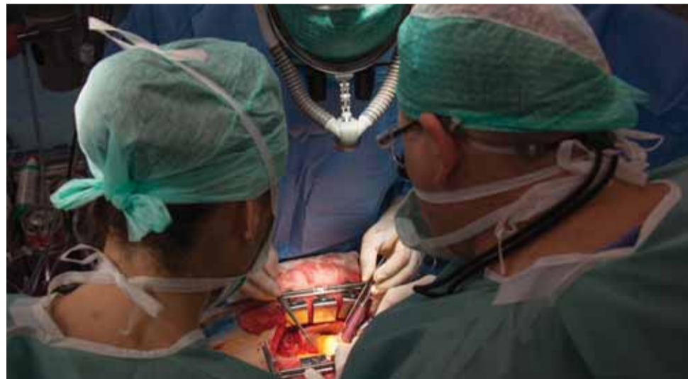
Na operačním sále.