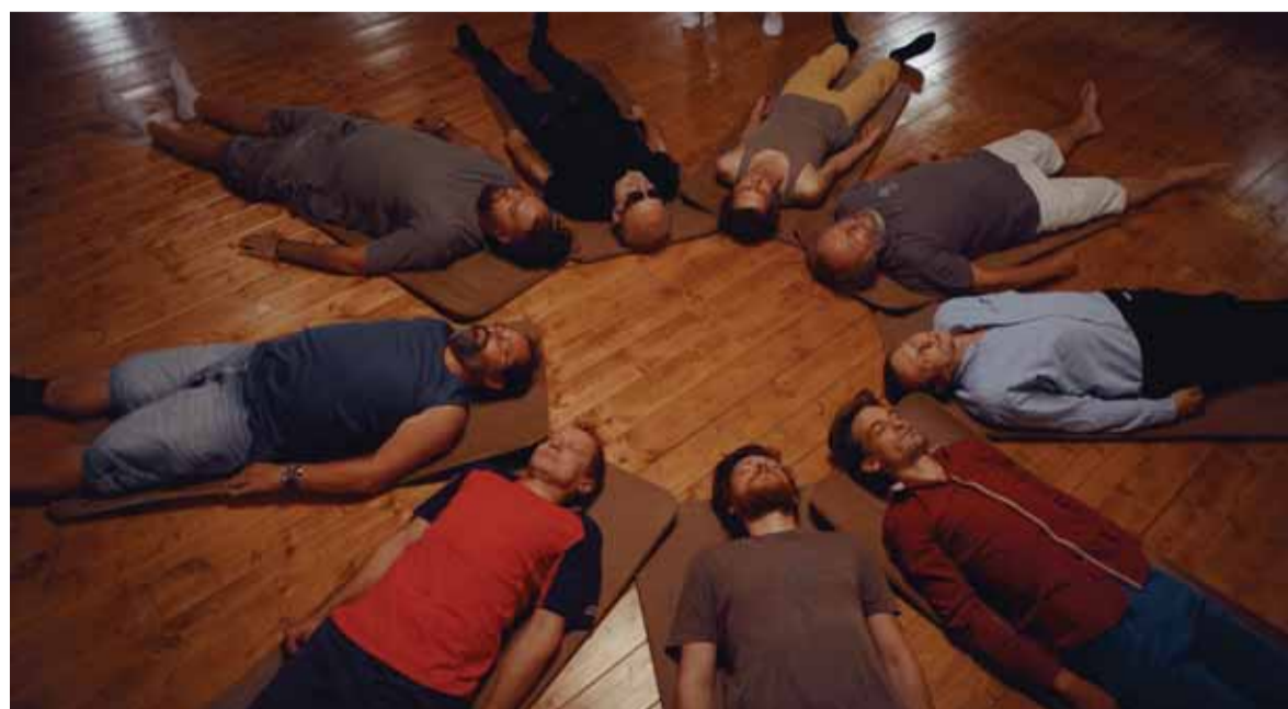
Hvězdné obsazení „alkáčů“ v léčebně.