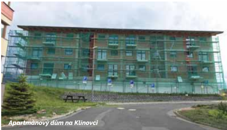
Apartmánový dům na Klínovci

V portfoliu jich máme přes tři desítky. Až na jednu realizujeme všechny pouze v Ústeckém kraji. Z řady staveb stojí určitě za zmínku rekonstrukce náměstí v Bilině nebo apartmánový dům na Klínovci.