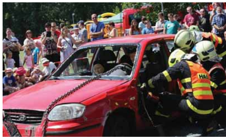
Dostat člověka z havarovaného auta se snažili hasiči.

Nechyběly ukázky, ve kterých šlo o život - vyproštění osob z havarovaného vozidla, vyzvednutí nevybuchlé munice z vody policejními potápěči nebo vznícení oleje pod dozorem hasičů. K vidění byla také vystavená záchranářská, policejní, hasičská i armádní technika. Děti si mohly vyzkoušet, jak se dává první pomoc zraněnému a jaké to je, když člověk havaruje v autě ve třicetkilometrové rychlosti.