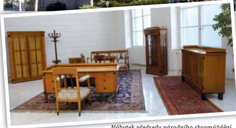
Nábytek předsedy národního shromáždění