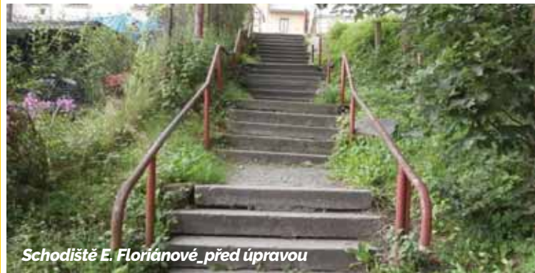
Schodiště E. Floriánové před úpravou

Jablonec n/N | I když se s opravami výtluků po zimě čeká na vhodnější počasí, statutární město Jablonec nad Nisou rozhodně nezáhá. Ke konci se chýlí oprava mostu v Proseči a do konce dubna budou hotové schody ve Floriánově ulici. Hned po Velikonocích se také začne pracovat na propojení ulic Mládi a Palackého ve Mšeně.