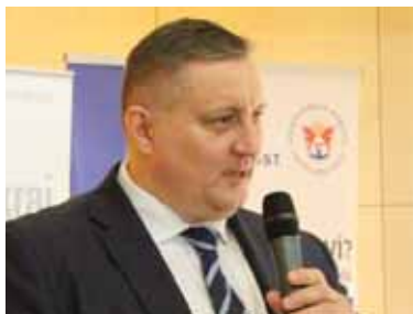
První náměstek hejtmána Martin Klika na Chemickém fóru Ústeckého kraje.

je důležitá příprava mladých odborníků. V rámci podpory přírodovědného a technického vzdělávání se na přípravě mladých chemiků podílí i Ústecký kraj,“ řekl při zahájení fóra Martin Klika.