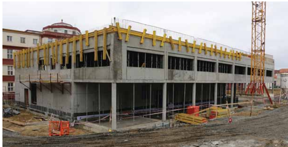
Výstavba pavilonu pro operační sály a centrální sterilizaci byla v areálu Nemocnice Teplice, o. z., která byla zahájena v červenci loňského roku, probíhá podle harmonogramu