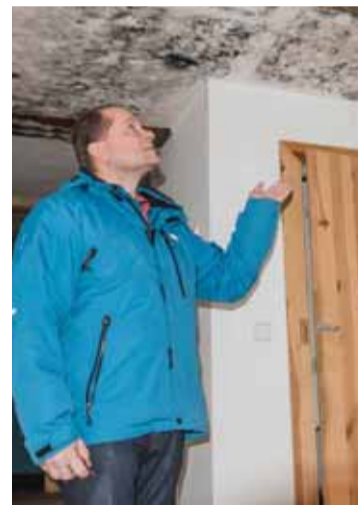
Mistostarosta Červín před roubenkou, která je ve špatném technickém stavu