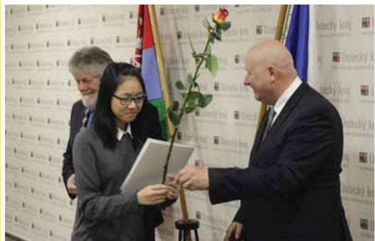
Hejtmán Ústeckého kraje Oldřich Bubeníček při slavnostním aktu

Dalších jedenáct lidí složilo v lednu na Krajském úřadě Ústeckého kraje státoobčanské sliby.