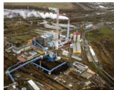
Ledvická elektrárna z ptáčích perspektiv

ková, manažerka návštěvníckého a vzdělávacího centra v Elektrárně Tušimice. Kroky zájemců loni vedly také do Elektrárny Počeradý. Lidé se například dozvěděli, jak funguje Paroplynový cyklus Počeradý. Nouzi o návštěvníky neměla ani Teplárna Trmice či Vodní elektrárna Střekov na Labi a malá vodní elektrárna Želina na řece Ohři.