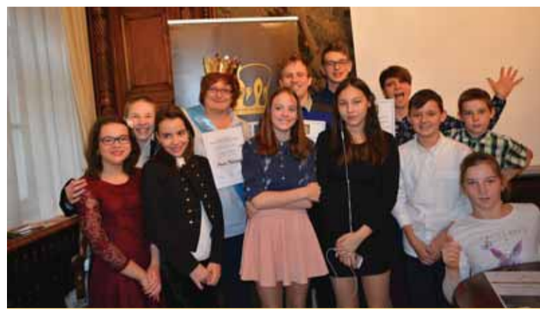
Více informací o soutěži je možné najít na adrese na www.zlatyamos.cz