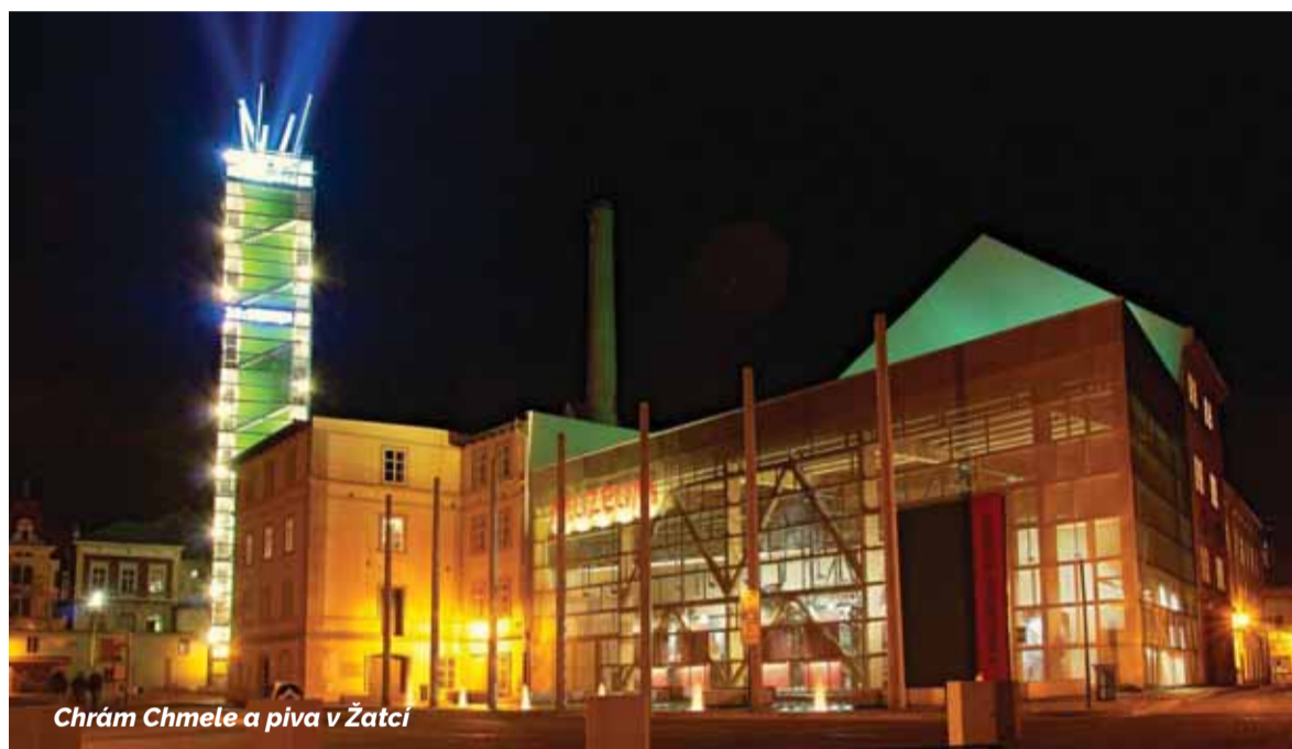
Chrám Chmele a piva v Žatci