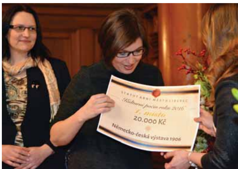
Loni titul a také 20 tisíc korun získala velkolepá Německá výstava 1906/2016

Loni titul a také 20 tisíc korun získala velkolepá Německá výstava 1906/2016, kterou společně pořádaly Oblastní galerie Liberec – Lázně a Severočeské muzeum. „Asi nejvíce jsou letos zastoupeny výstavy a expozice – třeba Oblastní galerie rovnou třikrát, hned poté úspěšně inscenace obou našich divadel i ocenění,