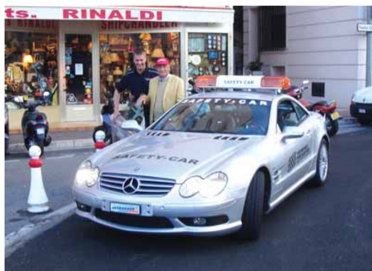
Legendární pilot F1 Niki Lauda (na snímku vpravo) se účastní akcí INTERRACE-TEAMU.

Nyní je ve vlastnictví INTERRACE více než 48 originálních závodních vozů F1 z let 1952-2007, mezi nimi i mnoho vozů mistrů světa. Sbirka se každý rok rozšiřuje, teď i o turnajové a sportovní vozy a závodní vozy z amerických soutěží.