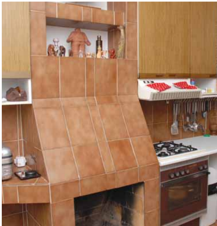
Kuchyň je vybavená klasickou linkou, ale zajímavostí v ní je krb začleněný ke kuchyňské lince, protože v tomto místě vede komín.

Text: Ludmila Petříková