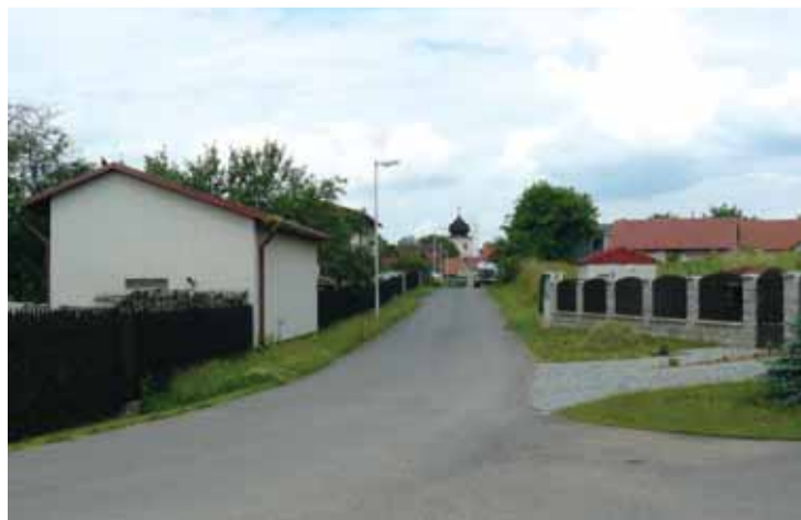
Cesta vede k rybníku, z něhož vytáhl Evžen Huml kapra nasazeného Bohoušem. V blízkosti rybníka se dnes nacházejí nové domy, v pozadí je vidět kostel, dominantu středočeské obce Višňová s více než šesti sty obyvateli.