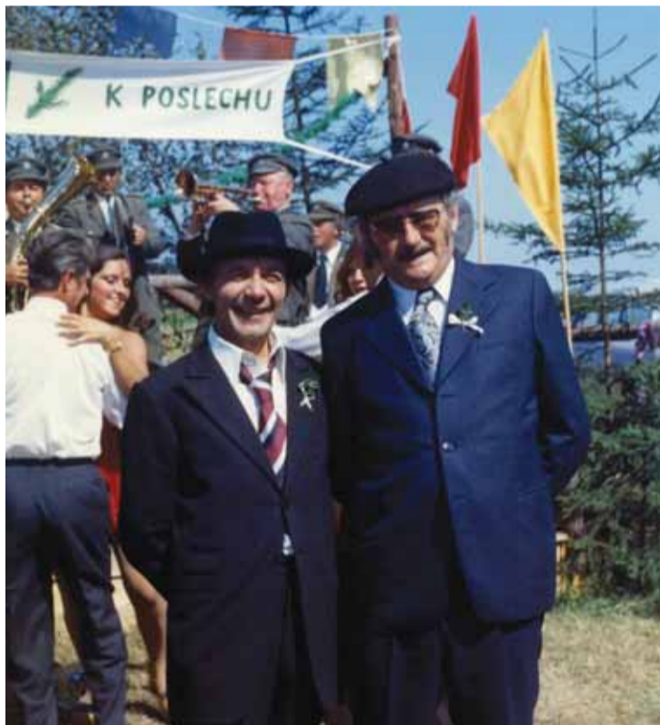
Bohouš a Evžen, podnájemník a domácí, na veselé Vlastičky a Fuchsové v závěrečném dílu jedenáctidílného seriálu. Snímek je z archivu ČT, která diváčky úspěšný seriál vydala na DVD.