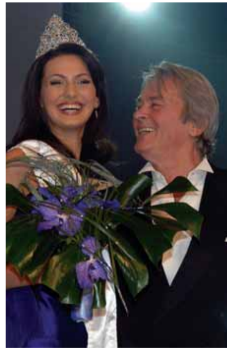
Šerpu České Miss 2008 Eliška Bučková předal legendární francouzský herec Alain Delon.

Spokojená jsem maximálně. Líbí se mi byt i Zahradní čtvrť, ve které se nachází. Cítím se tam skvěle i proto, že tahle část Prahy je ušetřena hluku velkoměsta, takže se mi tu dobře relaxuje a přitom se odtud rychle dostanu do centra.