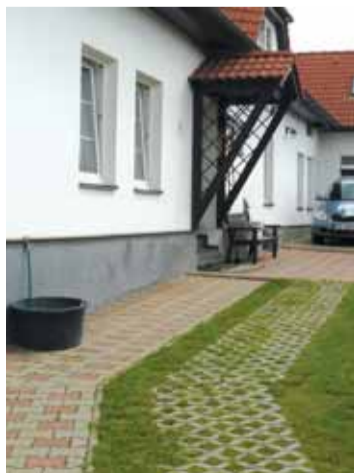
Tady bydleli Čihákoví. Anička si v dílu Režisér zapoměla klíče a na schůdkách před domem čekala, až přijde Čihák z práce.