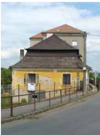
Fara, seriálová stará škola, jež se adaptovala na vejmíněk, do kterého se měl přestěhovat Bohouš. V pozadí základní škola.