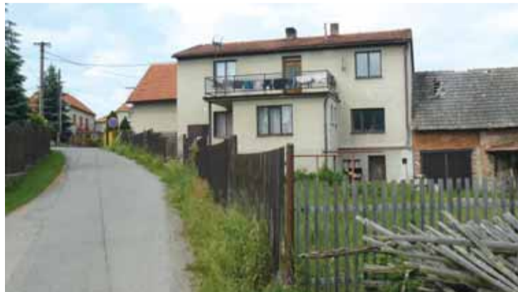
Věřili byste, že tento dům je slavná seriálová chalupa? Od doby natáčení se změnila takřka k nepoznání. Na spodním snímku jsou kůlny, vedle nichž stávala kadibudka.

V desátém a jedenáctém, závěrečném, dílu (Kapřin, Svatba) dělali kulisy všichni z vesnice. Točilo se hlavně u rybníka. Jak se k němu dostaneme? Máme-li hospodu po pravé straně, zatočíme doleva a jdeme stále rovně. Mineme dům, kde v části Smiřčí soudce stáli za vraty Fero a Aranka a pozorovali, jak psodví