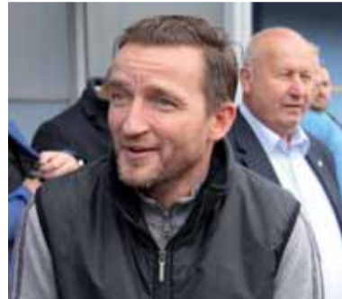
Patron turnaje Vladimír Šmicer.

„The Reds“, jak se týmu z Liverpoolu podle barvy dresů přezdívá, po oba dny předváděli pohledný fotbal, za který by se nemusely stydět ani některé české seniorské kluby. Ve finále si mladí Angličané poradili s polským Lubinem 2:0.