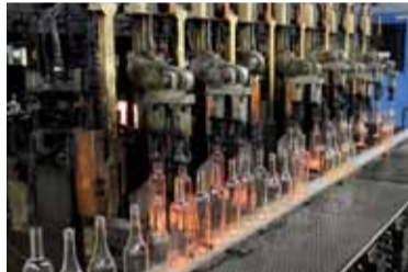
Denně se v závodě vyrobí 600 tisíc kusů.

setkání zástupců firmy a vrcholného managementu se starostou města Dubí Petrem Pipalem či krajským radním pro investice a majetek Ladislavem Drlym.