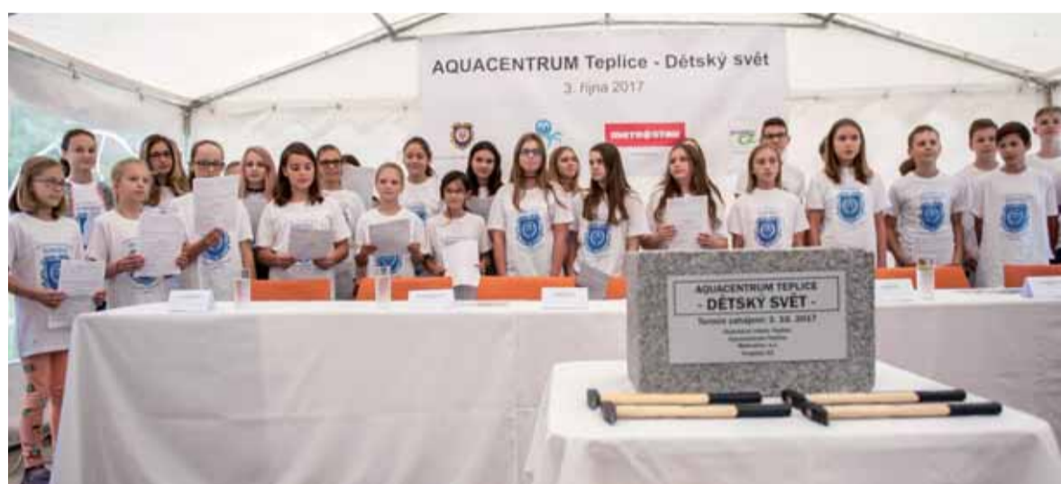
Svým vystoupením potěšili přítomné příznačně děti z pěveckého sboru Fontána ZŠ Maršovská v Teplících.