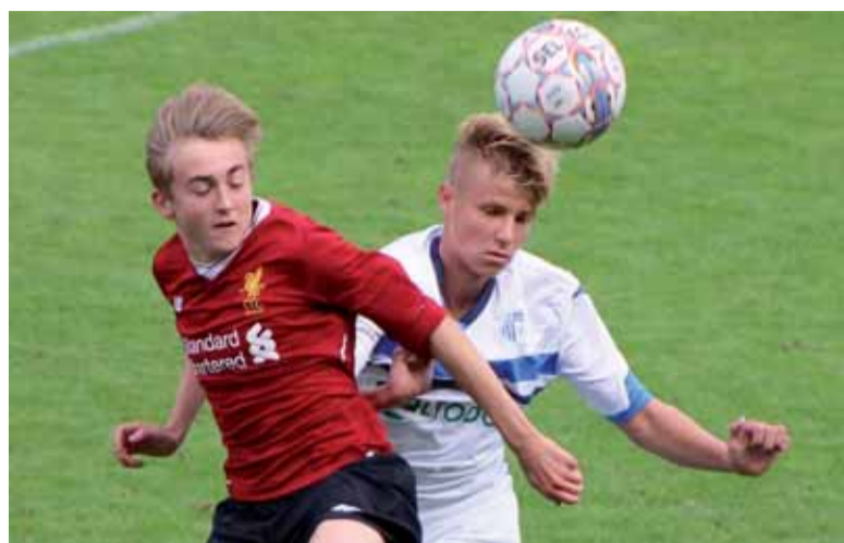
Obhájili! Fotbalisté Liverpoolu FC zvítězili po roce v Albim Cupu 2017.