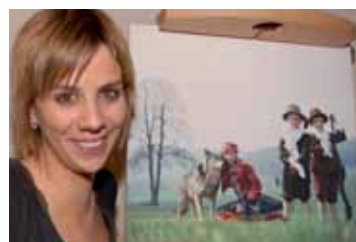
Mezi vyfotografovanými celebritami je i vítězka premiérové SuperStar Aneta Langerová.