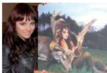
Zpěvačka Ewa Farna se svým snímekem v kalendáři pro příští rok.