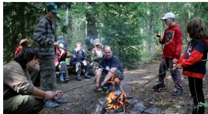
Na Radyni se vydala nedávno skupina ochránců a milovníků přírody z Rokycan. Součástí výletu byla přednáška o fauně a činnosti rokycanských ochránců přírody. Na závěr si účastníci opekli klobásky.

řeho Plzně, pár kilometrů od Plzně, občas objeví. V pravé poledne projede hradním areálem s kolečkem plným kolomazí a vzápětí nato se sthne silná