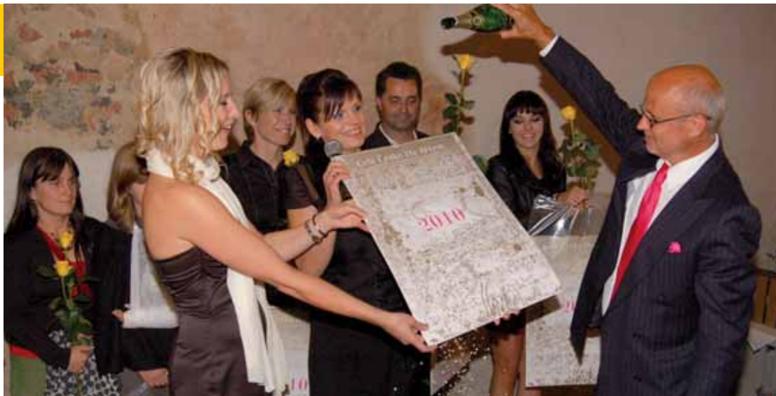
Kalendář Celé Česko čte dětem 2010 pokřtil producent a textař Michal Horáček.

Grafický návrh kalendáře je dílem Aleše Najbrta, jednoho z nejžádanějších českých grafiků. Do projektu Celé Česko čte dětem se již zapo-