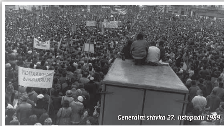
Generální stávka 27. listopadu 1989

Počátkem prosince bude ostravský projekt Cesta ke svobodě 89-09 zakončen multikulturním festivalem 20 let svobody. Tento multikulturní festival nabídne dokumentární ohlédnutí za listopadovými událostmi roku 1989 a za jejich společenskou reflexi. Součástí festivalu bude týdenní přehlídka filmových dokumentů spojená s besedami a vzpomínkami kon-