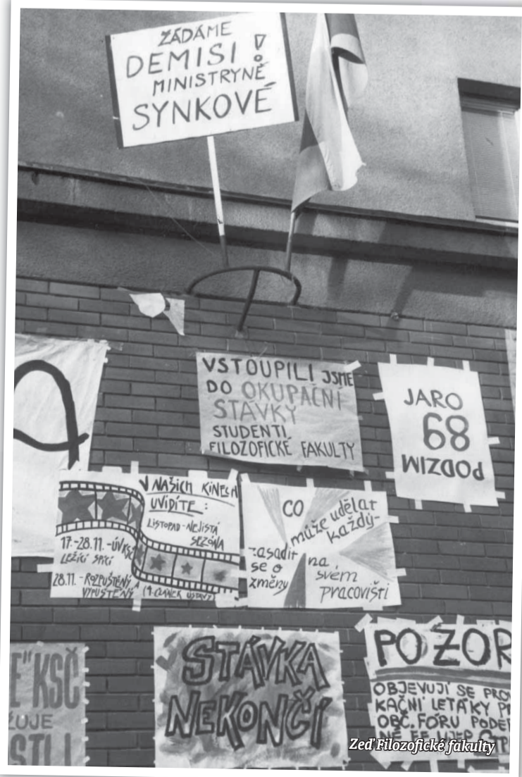
Zed Filozofické fakulty

Text: Alena Štouračová