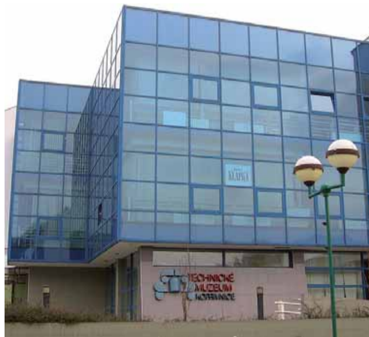
Technické muzeum Kopřivnice

a vzniká tzv. kočárovka. Třetí etapa stavebního rozvoje proběhla ve znamení výroby železničních vagonů. Rozvoj Kopřivnice díky této bouřlivé industrializaci dosahuje svého vrcholu. Nastupují sem první lékaři, dochází k rozšíření škol, je zde zřízen poštovní úřad. Postupně je obec napojena na železniční a telegrafní síť, začíná vydávat vlastní noviny. Výrobou prvního osobního automobilu koncem roku 1897 končí zlatá doba trvání kopřivnické kočárovky. Přes vzrůstající výrobu železničních vagonů hledá továrna nové výrobní možnosti pro stávající osazenstvo kočárov-