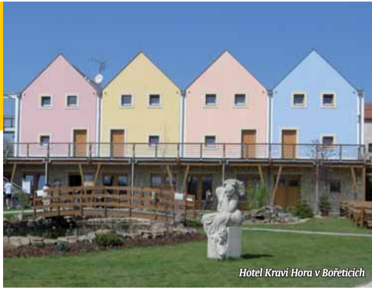
Hotel Kraví Hora v Bořeticích