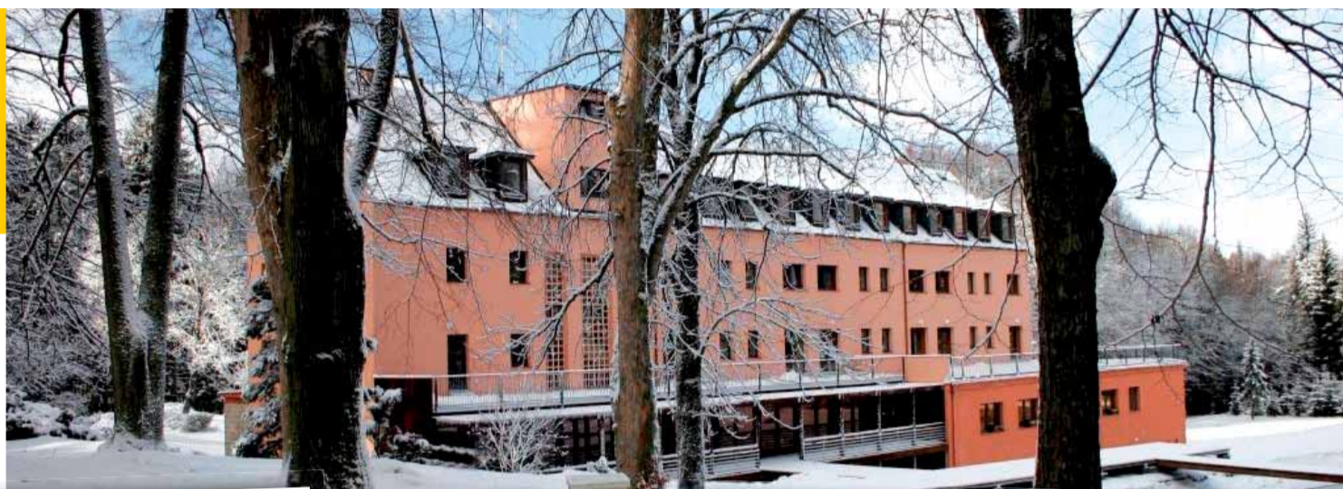
Hotel Svatá Kateřina - zima

Resort je místem pro každého, kdo je znavený stereotypem všedního života, chce si zasportovat, zbavit se přebytečných kilogramů, zrelaxovat uprostřed nedotčené přírody anebo přijít na jiné myšlenky. Po celý rok zde můžete čerpat sílu a energii ze široké škály sportovních a relaxačních programů.