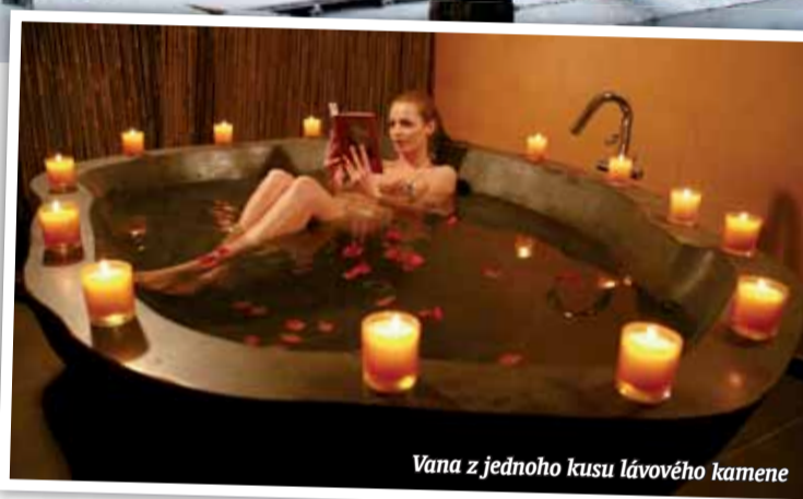
Vana z jednoho kusu lávového kamene

potravín a na moderním dietologickém přístroji jim v průběhu pobytu měří tukovou a svalovou tkáň, obsah vody, minerálních látek a další údaje. Tyto ukazatele jsou rozhodující pro nastavení stravovacího programu, pitného režimu, plánu doplňování stravy, rozvržení pohybových aktivit a preventivních opatření ve vztahu k civilizačním nemocem. Během pobytu v Resortu Svatá Kateřina tak můžete přejít ke zdravějšímu způsobu života a nastavit si jak správné stravování a pitný režim, tak aktivní tělesné zatížení, úměrně vašemu věku a kondici.