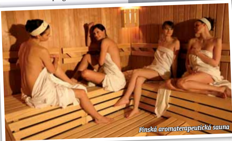
Finská aromaterapeutická sauna