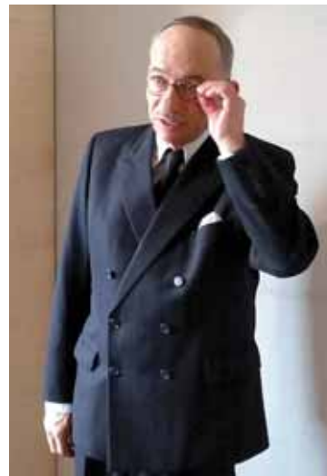
Teplice už mají svého prezidenta