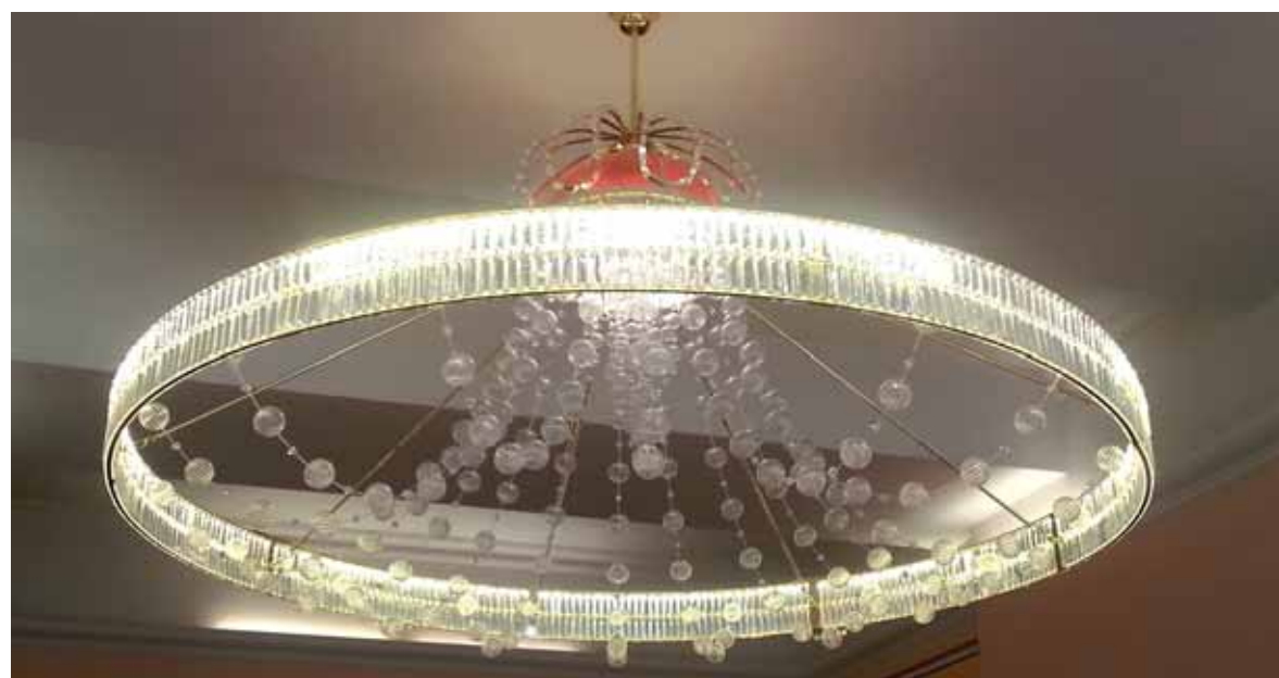
Novým unikátním lustrem se pyšní vstupní hala Cisařských lázní.