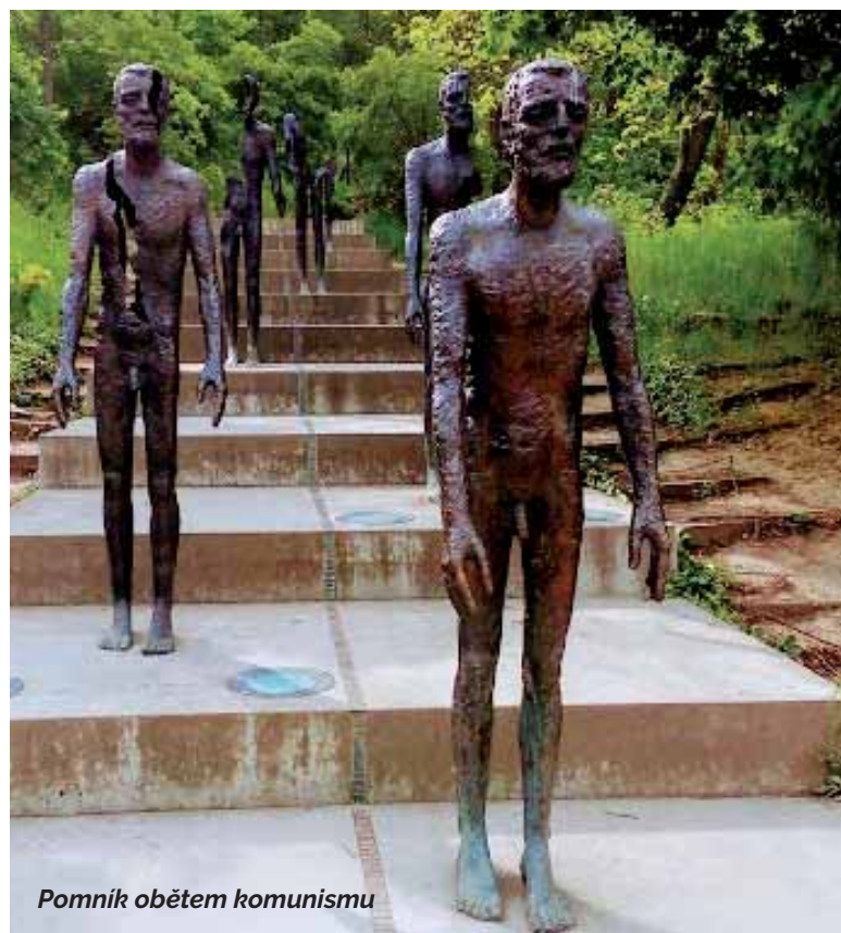
Pomník obětem komunismu