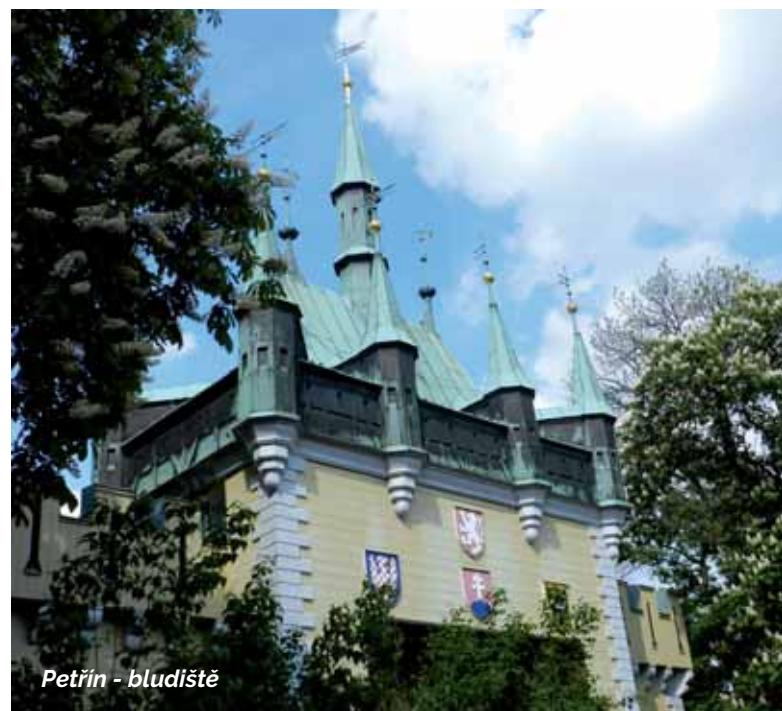
Petřín - bludiště