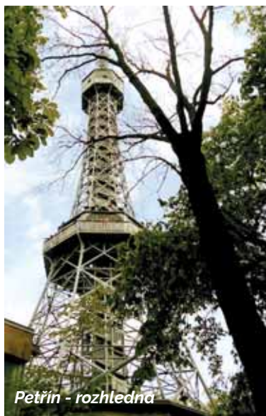
Petřín - rozhledna

Na Petřín se dostanete z více stran, jednou z možností je vchod z ulice Újezd, dále pak ze sousední Seminářské zahrady, nebo z Kinského zahrady, odkud můžete přijít několika průchody přímo v Hladové zdi. Hlavní část zahrady, která vede na vrchol Petřína, se nachází na příkrém svahu a je propletená řadou cest. Pokud vyrazíte z Újezda, kde má zastávku několik linek tramvajové dopravy, hned na začátku stojí ne-