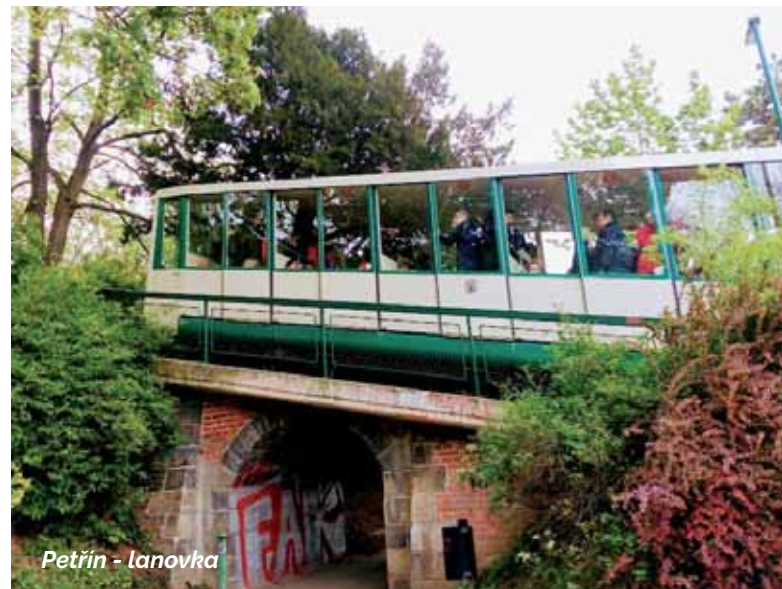
Petřín - lanovka