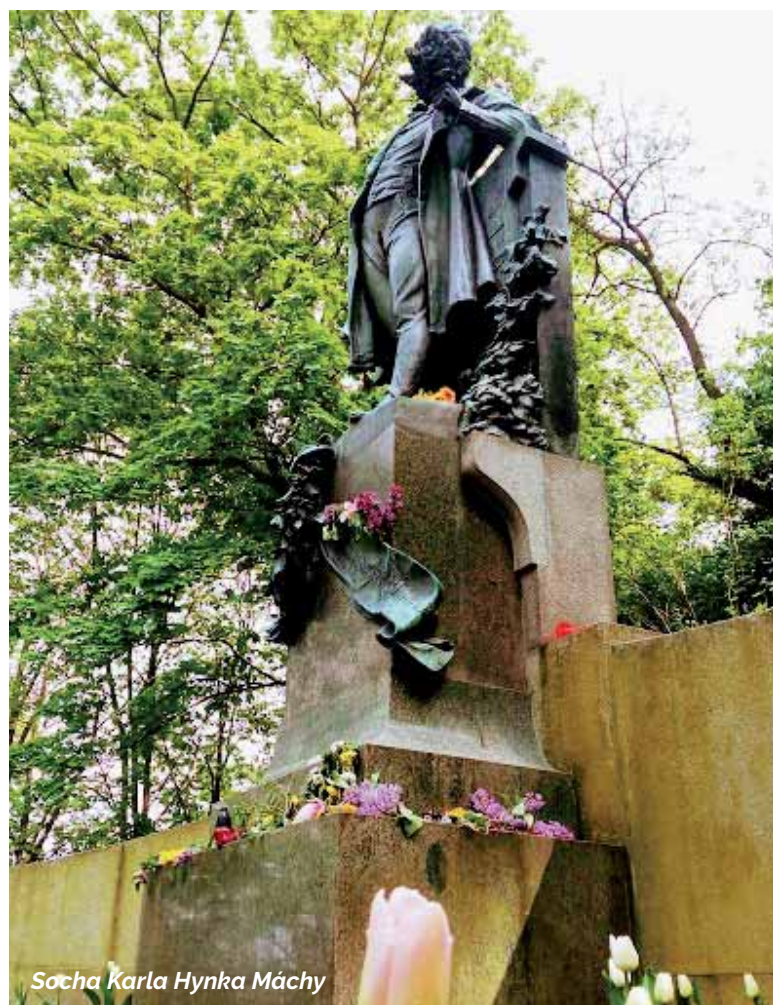
Socha Karla Hynka Máchy

te Hladovou zdi a Růžovým sadem do Štefánikovy hvězdárny, která je otevřena každý den kromě pondělí. Pro návštěvníky, kterým se nebude chtít vyjít pěšky na vrchol, vede ke hvězdárně z Újezda se zastávkou na Nebozizku lanová dráha. Jede necelých 5 minut, od 9 hodin v intervalu každých 10 až 20 mi-