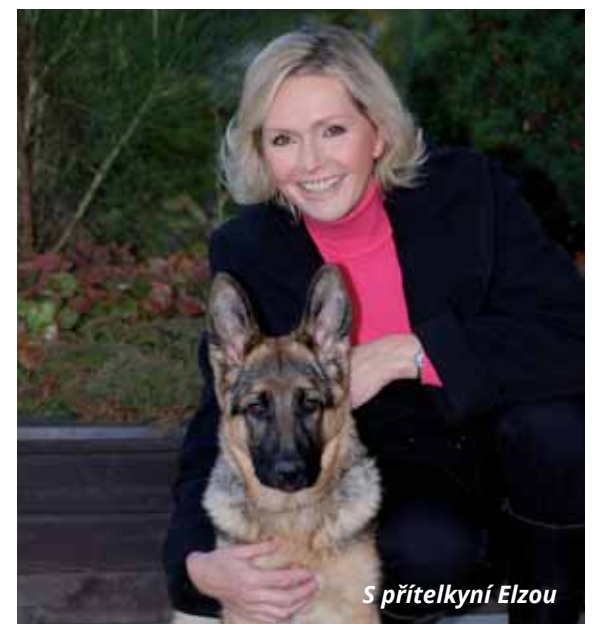
S přítelkyní Elzou

Připravila: Šárka Jansová