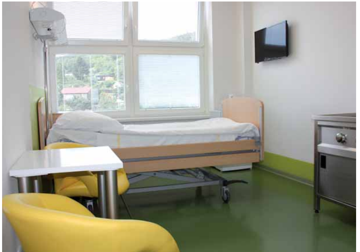
Nadstandardní pokoj na stanici šestinedělí gynekologicko-porodnického oddělení mostecké nemocnice. Rekonstrukcí a modernizací prošla stanice v loňském roce.

To vše by se nepodařilo realizovat bez dotačních titulů a investiční podpory, kterou má vedení společnosti v Ústeckém kraji, zakladateli a jediném akcionáři Krajské zdravotní. Současné vedení Krajské zdravotní, a. s., která v Česku patří k největším poskytovatelům zdravotní péče, klade velký důraz i na sociální a mzdovou politiku v oblasti odměňování zaměstnanců. Představenstvo rozhodlo o navýšení mzdových prostředků pro své zaměstnance pro rok 2017, a to