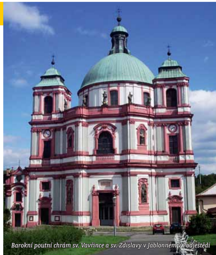
Barokní poutní chrám sv. Vavřince a sv. Zdislavy v Jablonném v Podještědí

Jsme blíže k zámku a cesta se ubírá pěkně do kopce. Projdeme krásnou lipovou alejí, jejíž koruny jistě pamatují mnohé. Kéž by mohly vyprávět... Pár set metrů před Lemberkem, pod mohutnými stromy, stojí Letohrádek Bredovských s nádhernou zahradou, kterou z cesty schovává polorozbořená zed', jde o stavbu z počátku 17. století. Vchod do zahrady zdobí nádherný barokní portál s Bredovským erbem. Odtud je vidět na prvním parteru kamenný oválný stůl. Na zahradě je spousta podobných klidných zátiší, nechybí tu okrasné vodní plochy a sochy.