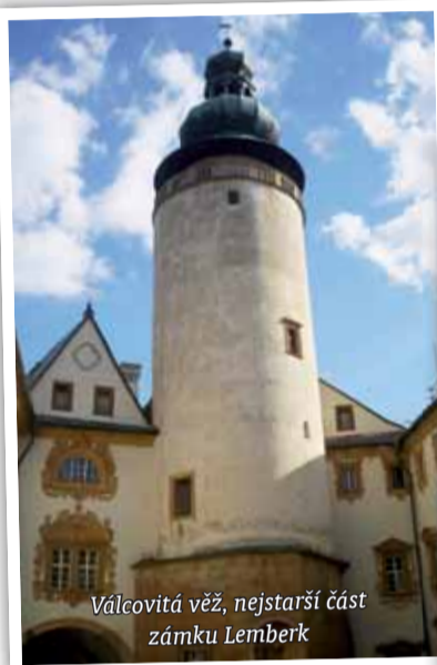
Válcovitá věž, nejstarší část zámku Lemberk