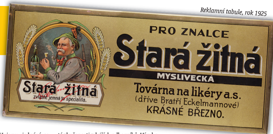
Reklamní tabule, rok 1925