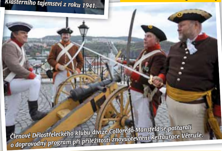
Členové Dělostřeleckého klubu divize Colloredo-Mansfeld se postarali o doprovodný program při příležitosti znovuotevření Restaurace Větruše.