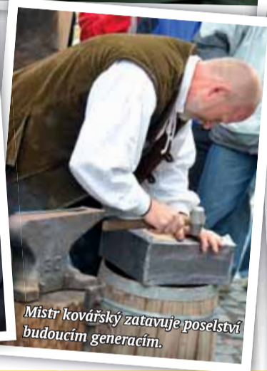
Mistr kovářský zatavuje poselství budoucím generacím.