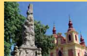
Letošním vítězem soutěže Vesnice roku se stalo Nové Sedlo na Lounsku.

V Litoměřicích se uskutečnilo největší setkání partnerů venkova v České republice v rámci národní konference VENKOV 2016. Ústředním tématem 8. ročníku, který po Zlínském kraji hostil Ústecký kraj, se stal člověk a jeho role ve vztahu k venkovu.