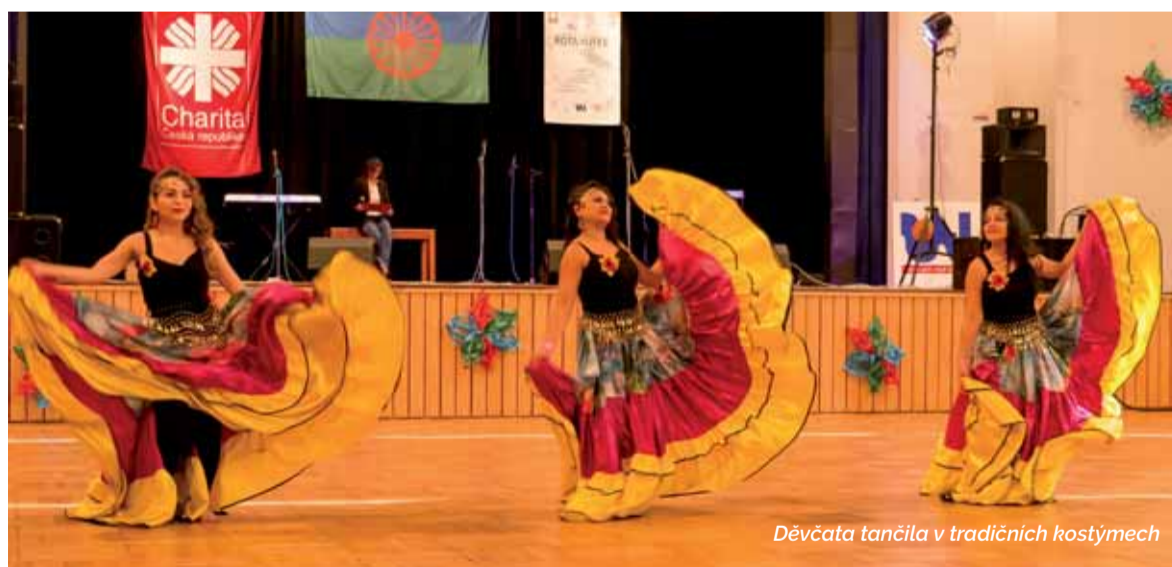
Děvčata tančila v tradičních kostýmech

V ústeckém Domě kultury se uskutečnil za podpory Ústeckého kraje 10. ročník romského tanečního hudebního festivalu Rotahufest.