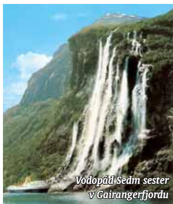
Vodopád Sedm sester v Gairangerfjord.

tem nebo přes Öresundský skandinávský most s čtyřproudou dálnicí či dvoukolejovou elektrifikovanou tratí. Na dánské straně se jede nejdříve téměř po půl kilometru dlouhém umělém poloostrově, na němž začíná tunelová část trasy dlouhá 3 510 metrů. Tunel se vynoří uprostřed průlivu Öresund na uměle nasypáném ostrově Papparholm o délce čtyř kilometrů, aby pokračoval nejdílejší a nejatraktivnější částí, dvouúrovňovým mostem s celkovou délkou 7 845 metrů.