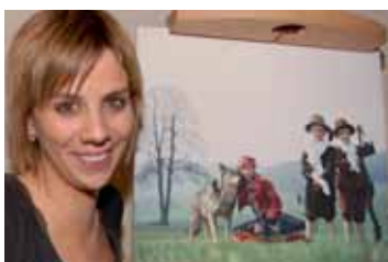
Mezi vyfotografovanými celebritami je i vítězka premiérové SuperStar Aneta Langerová.