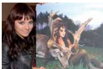
Zpěvačka Ewa Farna se svým snímekem v kalendáři pro příští rok.

jilo přes 300 institucí, škol, mateřských center, psychologických porad, dětských oddělení nemocnic i jednotlivců. Čtyřicet osobností již s velkým ohlaselem dětem veřejně předčítalo. „Naprostě zásadní je čtení doma. Jde totiž i o citový rozvoj. O společné sdílení času, o pocit dítěte, že rodič právě teď patří jen jemu. O ujištění, že je milované. Pohádku nemusí vždy číst jen maminka, když se