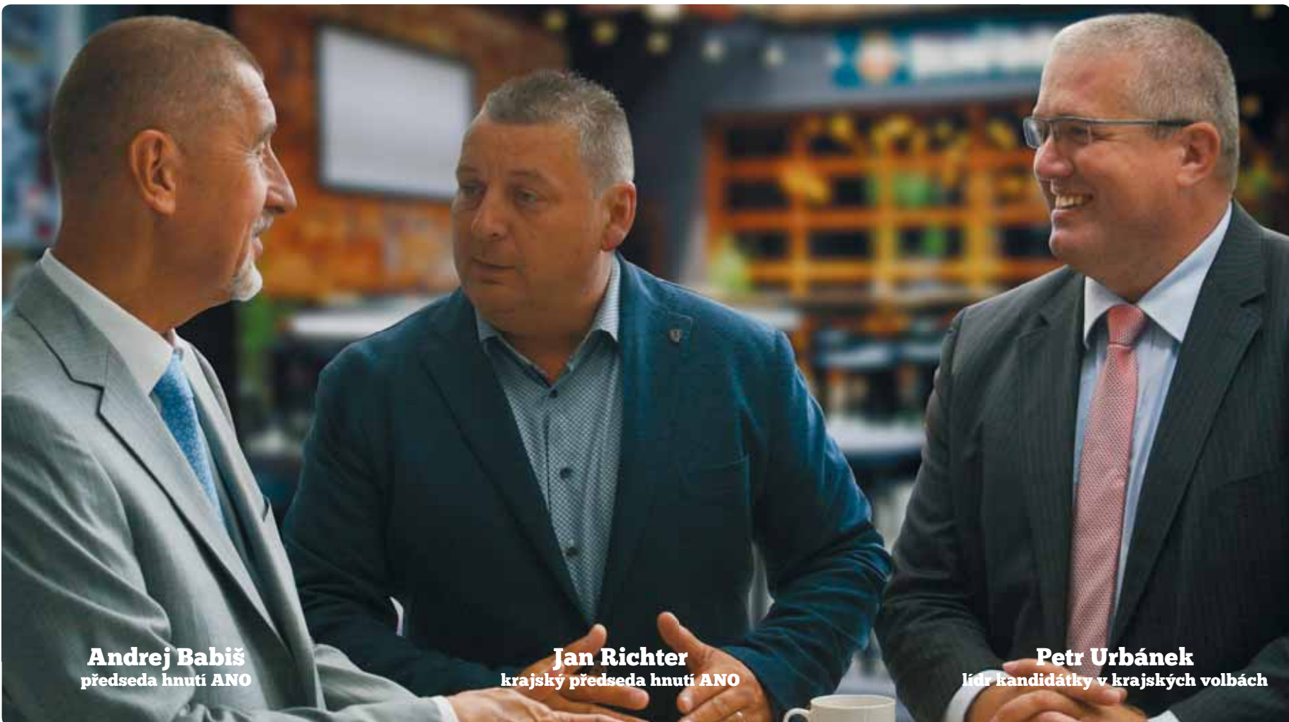
Andrej Babiš předseda hnutí ANO