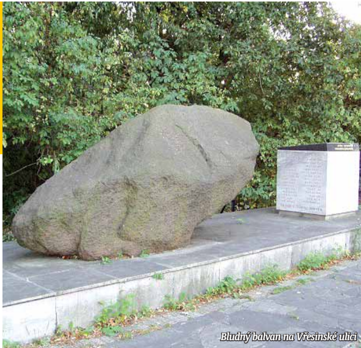
Bludný balvan na Vřesinské ulici

Zajímavý je demografický vývoj Poruby. Počet obyvatel nepřesáhl až do počátku 20. století několik stovek. Obec si zachovala svůj vesnický ráz s převahou rolníků, zahradníků a dalších živnostníků. Zaměstnání v průmyslu tehdy nabízely jen ostravské podniky. První továrna firmy Ignác Blažej vyrábějící nábytek byla založena v roce 1903. V roce 1925 byla postavena místní železniční dráha ze Svinova do Vřesiny,