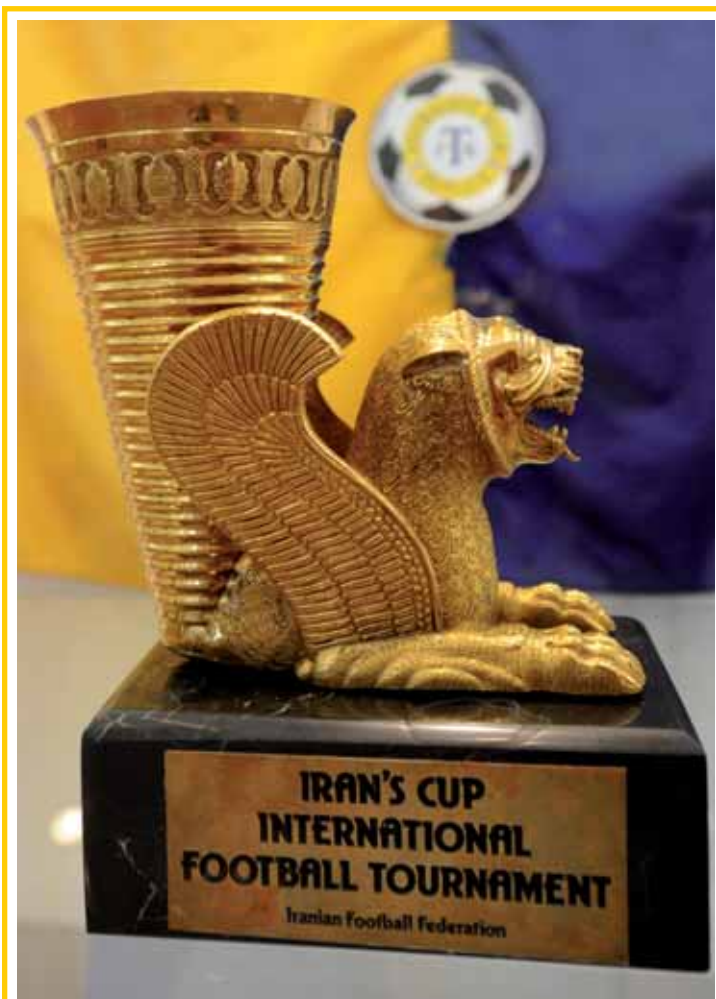
V roce 1975 reprezentoval tehdejší Sklo Union Teplice na Perském poháru v Iránu. Teplický celek byl jediným klubem v turnaji, čelil tak několika reprezentacím. Postupně se utkal s domácím Iránem, reprezentací Sovětského svazu do 23 let, v semifinále pak s Polskem do 23 let a ve finále s olympijským mužstvem Iránu. Za vítězství získali hráči zlatý Perský pohár, který byl putovní a teplický tým ho měl o rok později obhajovat, ale vzhledem k politickému převratu se již žádný ročník nekonal a zlatý, téměř 2 kilogramy vážící pohár zůstal v držení teplického klubu.