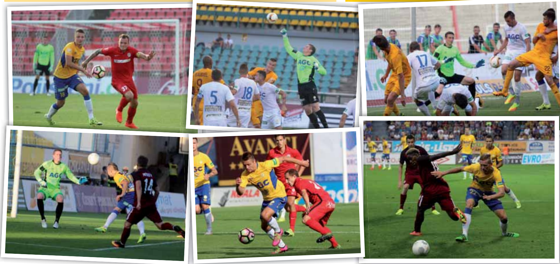
Do třetího kola ePojisteni.cz nejvyšší fotbalové soutěže zůstaly Teplice neporaženy, navíc bez obdržení gólu.