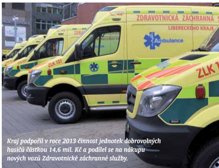
Kraj podpořil v roce 2013 činnost jednotek dobrovolných hasičů částkou 14,6 mil. Kč a podílel se na nákupu nových vozů Zdravotnické záchranné služby.