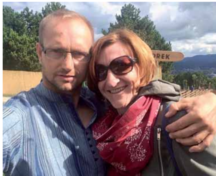
S manželkou podporujeme fairtrade i nákupem férového oblečení.

Vzhledem k tomu, že jsme elektronicky měření pomocí peoplemetrů – stejně jako další celoplošné televize – máme celkem jasný přehled o divácích. Týdně si program Regionálnitelevize.cz pustí necelých 200 000 lidí a nejvíce nás sledují muži 15+ mezi 14. a 18. hodinou. U nás v Ústeckém kraji je sledovanost ješ-