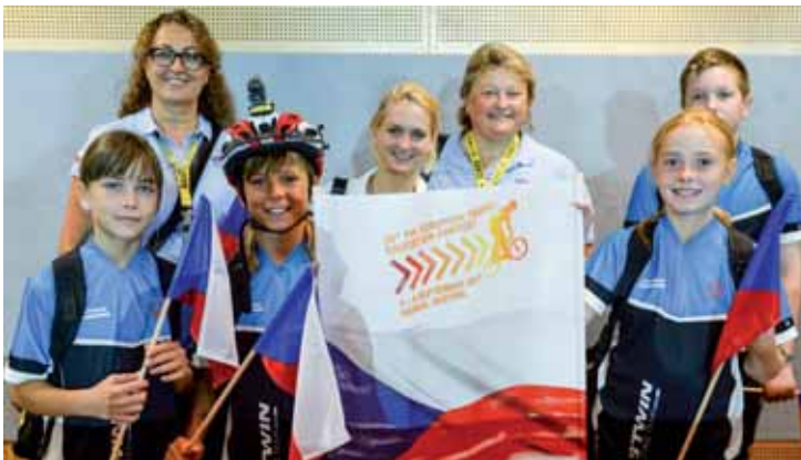
Vloni byla dějištěm akce rakouská metropole a čeští zástupci si pochvalovali organizaci.

Představitelé tohoto klubu oslovili vedení Ústeckého kraje jako osvědčeného pořadatele dopravních soutěží mladých cyklistů a vyzvali ke spoluorganizaci výše uvedené soutěže. Vedení Ústeckého kraje tuto nabídku přijalo, velmi si toho váží a bere ji jako ocenění za úspěšné a profesionální uspořádání jak krajských kol, tak i zejména Celostátního finále dopravní soutěže mladých cyklistů, které Ústecký kraj pořádal v průběhu deseti let již podruhé. Pro kraj je to příležitost, jak podpořit tuto dětskou bezpečnostní iniciativu a zdůraznit důležitost výchovy dětí k bezpečnosti silničního provozu na národní úrovni.