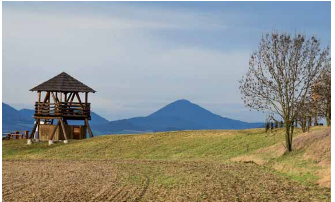
Rozhledna stojí na nejvyšším bodě původního valu keltského hradiště. V pozadí vpravo Milešovka.

Konečně přijíždíme do nedaleké obce Peruc, odkud plánujeme vyrazit na pěší okruh. Byla by škoda se tu nezastavit, neboť zde najdeme zámek s muzeem a parkem, Boženinu studánku a jeden z našich nejpatrnějších stromů – Oldřichův dub. Tento mohutný strom, který dokonce figuruje na seznamu nejvýznamnějších stromů UNESCO, najdeme ve spodní části parku, přesně v místě, kde se podle pověsti setkal Oldřich s Boženou. Stáří stromu se odhaduje na přibližně tisíc let, vysoký je 31 metrů a po obvodu má úctyhodných 760 centimetrů. Parkujeme v údolí u hotelu Oldřichův dub a vyrazíme po trase naučné stezky směrem na Stradonice. Široká lesní cesta se vine kaňonem Dě-