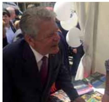
Německý prezident Joachim Gauck při prohlídce stánku Ústeckého kraje.

Obě oblasti České Švýcarsko a Saské Švýcarsko úzce spolupracují na poli cestovního ruchu už od roku 2005, proto představili nabídku cestovního ruchu na obou stranách Labských pís-