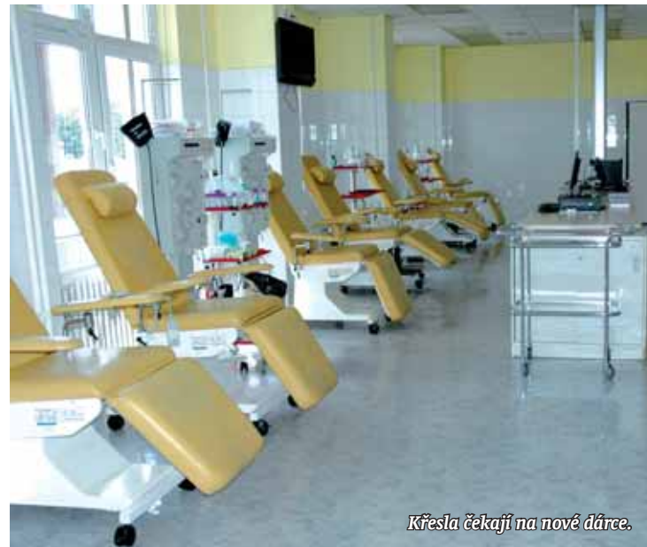
Křesla čekají na nové dárců.

Aby přišli a posílili registr dárců. Nemusí kvůli tomu nic zvláštního ře-