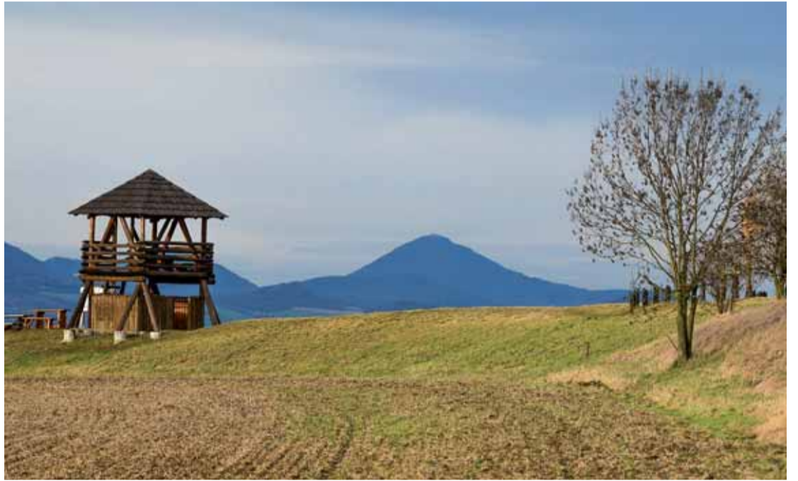
Rozhledna stojí na nejvyšším bodě původního valu keltského hradiště. V pozadí vpravo Milešovka.

Konečně přijždeme do nedaleké obce Peruc, odkud plánujeme vyrazit na pěší okruh. Byla by škoda se tu nezastavit, neboť zde najdeme zámek s muzeem a parkem, Boženinu studánku a jeden z našich nejpamátnějších stromů – Oldřichův dub. Tento mohutný strom, který dokonce figuruje na seznamu nejvýznamnějších stromů UNESCO, najdeme ve spodní části parku, přesně v místě, kde se podle pověsti setkal Oldřich s Boženou. Stáří stromu se odhaduje na přibližně tisíc let, vysoký je 31 metrů a po obvodu má úctyhodných 760 centimetrů. Parkujeme v údolí u hotelu Oldřichův dub a vyrazíme po trase naučné stezky směrem na Stradonice. Široká lesní cesta se vine kaňonem Dé-