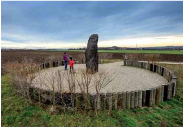
Kamenný pastýř je největší menhir v České republice, jeho výška je bezmála 3,5 metru.