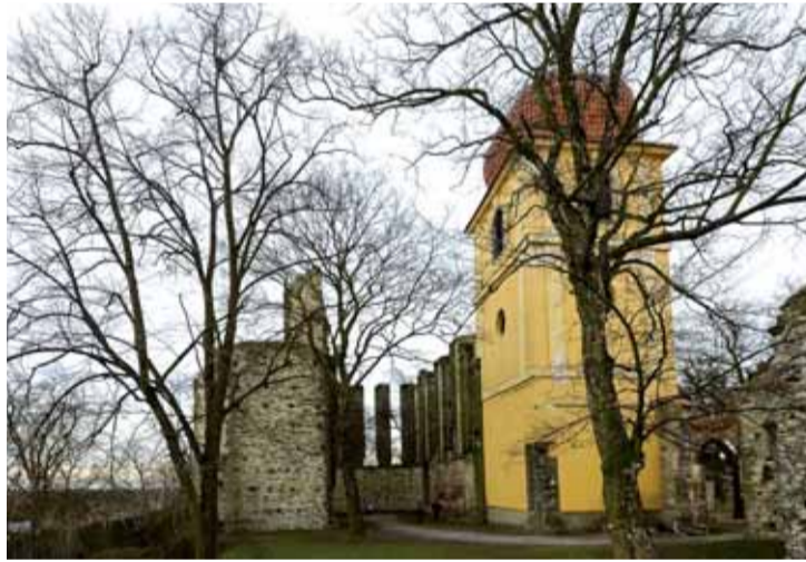
Nedokončený gotický chrám v Panenském Týnci navštěvují milovníci historie i hledači pozitivní energie.