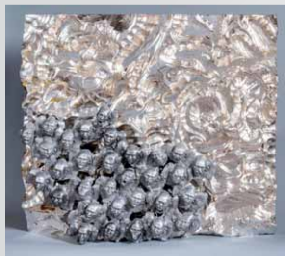
Richard Stipl - Mirabilia , 2014, 80x90x14cm, dřevo, plátkové stříbro a hliník