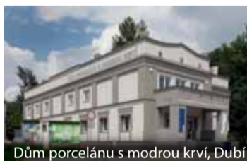
Dům porcelánu s modrou krví, Dubí