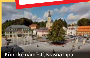
Křínické náměstí, Krásná Lípa