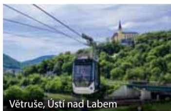
Větruše, Ústí nad Labem