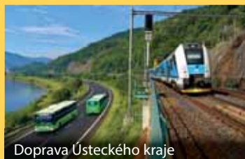
Doprava Ústeckého kraje