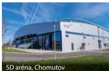
SD aréna, Chomutov