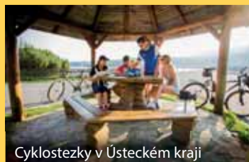
Cyklostezky v Ústeckém kraji

15 let práce pro Vás http://15letuk.kr-ustecky.cz