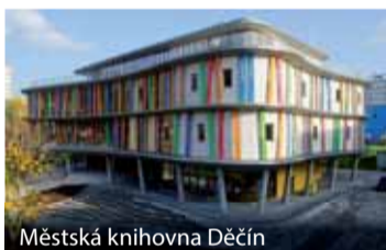
Městská knihovna Děčín