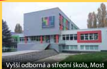
Vyšší odborná a střední škola, Most