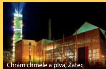
Chrámeček chmele a piva, Zatec