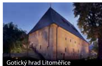
Gotický hrad Litoměřice