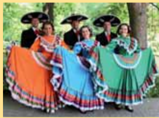
Vloni bylo k vidění na festivalu mnoho zajímavých oděvů.

Folklorní festival „České středohoří“, založený před šesti lety, se stal již součástí kulturního života Ústeckého kraje. Letos se 6. Mezinárodní folklorní festival odehraje opět v letním amfiteátru v obci Třebívlice u Lovosic, a to 28. května.