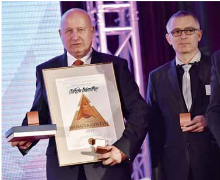
Hejtman Ústeckého kraje si přebíral na Žofíně ocenění Manažer roku 2015.

tantů managementu v České republice. Je prezentací moderních metod firemního řízení, jejich vývoje a trendu. Umožňuje ocenit osobnosti managementu, prezentovat jejich výsledky širší veřejnosti a poukázat na jejich úlohu v rozvoji české ekonomiky. K objektivnímu posouzení účastníků soutěže a k regulérnosti jejího průběhu je vytvořen Řídící výbor soutěže, složený ze zástupců vyhlášovatelů a partnerů soutěže, vrcholových manažerů a odborníků z oblasti managementu. Hodnocení provádí Hodnotitelská komise jmenovaná Řídícím výborem soutěže.