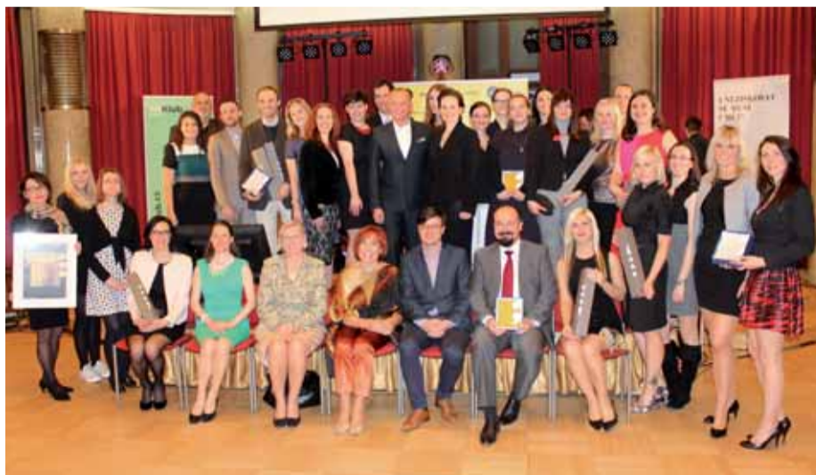
Všichni ocenění spolu s odbornou porotou.

Hned dvě nominace se podařilo proměnit Krajskému úřadu Ústeckého kraje v soutěži Zlatý středník. Ceny, kde se každoročně hodnotí nejlepší firemní periodická i neperiodická média, vyhlásil PR Klub již po třinácté. Do Ústeckého kraje putuje třetí místo za výroční zprávu roku 2014 a druhé místo patří grafickému manuálu Her VII. zimní olympiády dětí a mládeže. Mezi 127 přihlášených periodik rozdala odborná porota ceny hned ve 14 kategoriích.