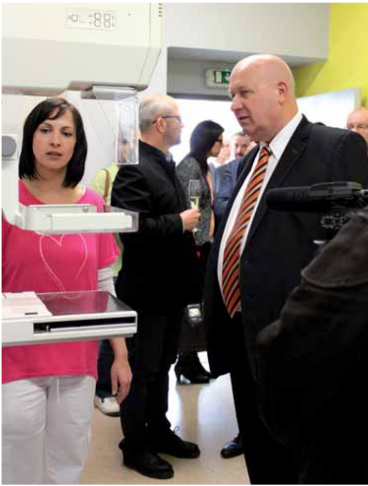
Hejtman Ústeckého kraje Oldřich Bubeníček si se zájmem prohlíží nový mamograf.

Vybudování tohoto pracoviště bylo schváleno odbornou komisí Ministerstva zdravotnictví. Dochází tak ke zvýšení dostupnosti preventivní péče a zkrácení čekacích dob na vyšetření v regionu. Hlavním cílem všech zúčastněných je zkrátit dojezdové vzdálenosti pacientek, zkrátit čekací doby na vyšetření a přispět ke zlepšení prevence a diagnostiky nádorů prsu. Ke zkrácení čekacích dob by měla pomoci i možnost objednávání on-line přes webové stránky.