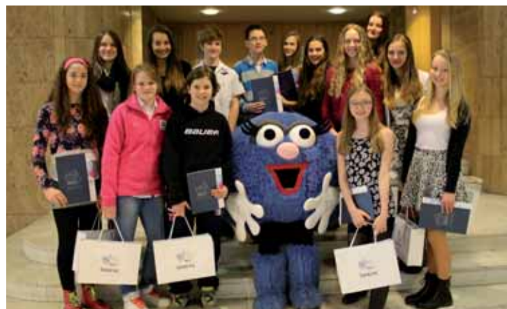
Závěrečná fotografie medailistů s maskotem olympiády Bambu.