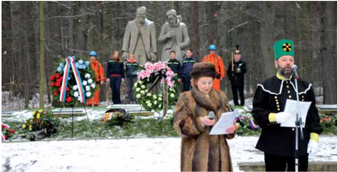
Pietního aktu se zúčastnili i zástupci bratrských spolků horníků ze sousedního Saska.

Výbuch na povrchu, zřícení důlních budov a následný požár v hlubinném dolu Nelson III nastal ve středu 3. 1. 1934 před pátou